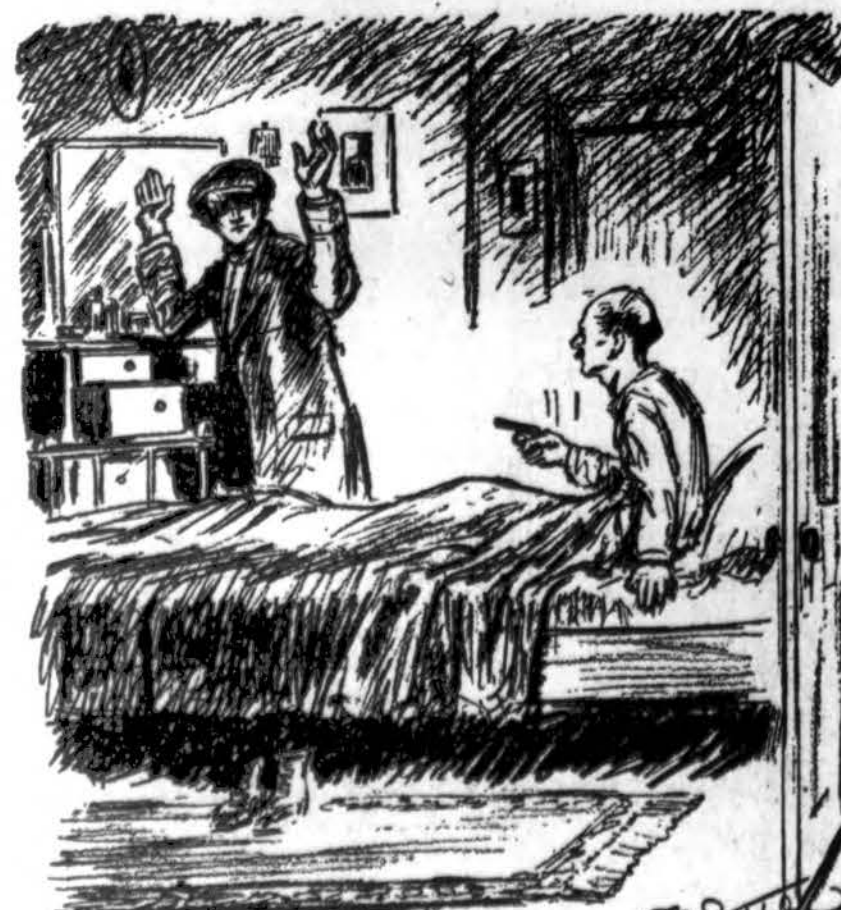
FOR FUTURE REFERENCE Husband: "Say, pardner, just between men, tip me off. How did you get in so quietly?"