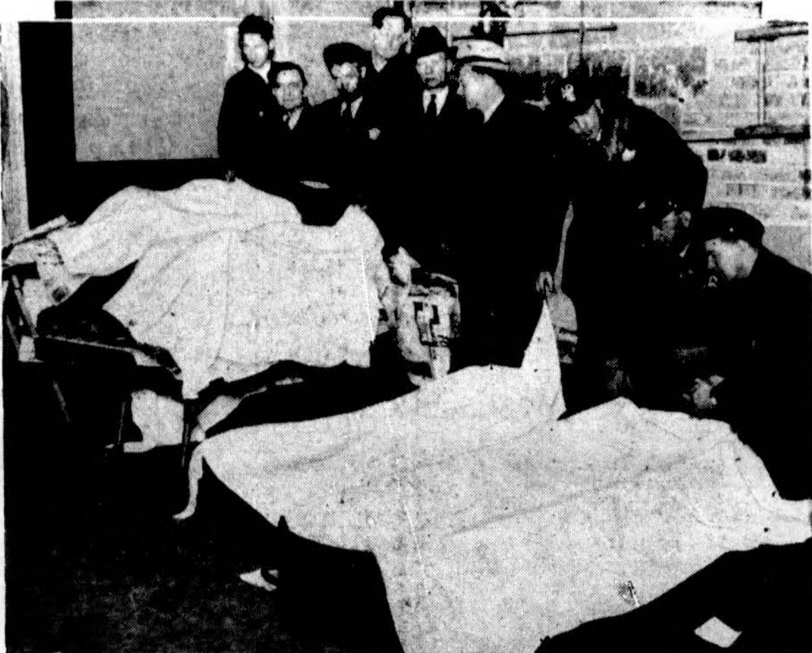
Šiame paveiksle matyti lavonai žuvusių anksti sekmadienio ryto Rendezvous Club užėgą. Nė vienas iš čia gulinių šeštadienio vakare nemanė, kad jie sekmadienį jau nebegalės matyti savųjų.