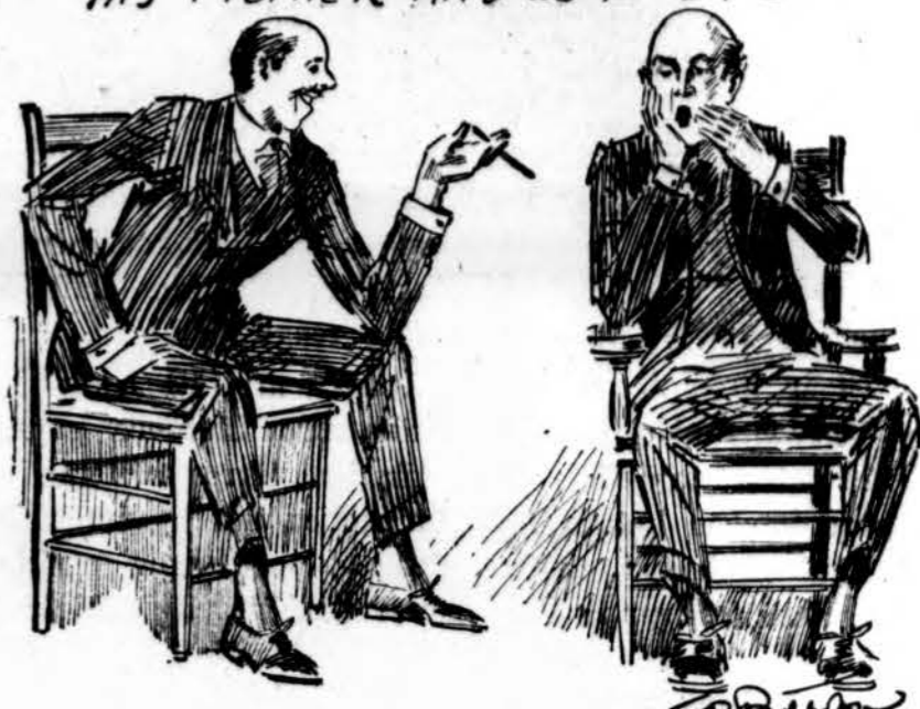
Puzzle—Find the papa who is talking about his son and heir.

"AND THEN HE SAYS 'DADA LOVE MAMMA' JUST LIKE IN THE COMICS. AND SAY'S HE GOOD LOOKING? SAY THAT KID HAS 'EM ALL LICKED FOR LOOK'S. SOME THINKS HE LOOKS LIKE HIS MOTHER AND SOME ETC