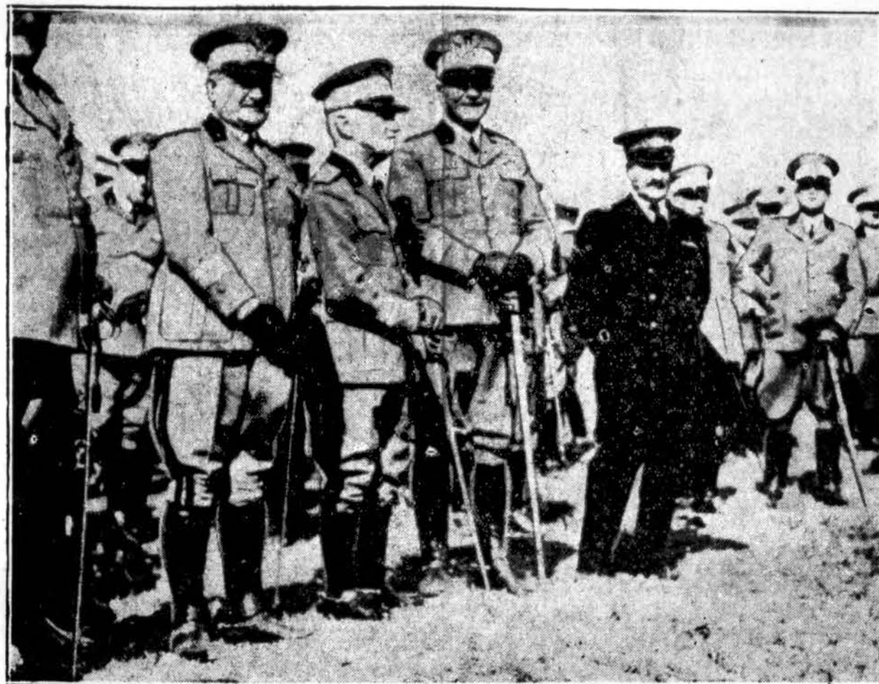
Italijos karalius Viktoras Emanuelis (antrasis iš dešinės), lydimas sosto įpėdinio Umberto ir karo pasekretoriaus gen. Baistrocchi, dalyvauja militarinės raitelių mokyklos Tor di Quinto kadetų manevruose.

Kaune gauta žinių, kad į Klaipėdos krašto pasienį sutraukiama daugiau vokiečių kariuomenės.