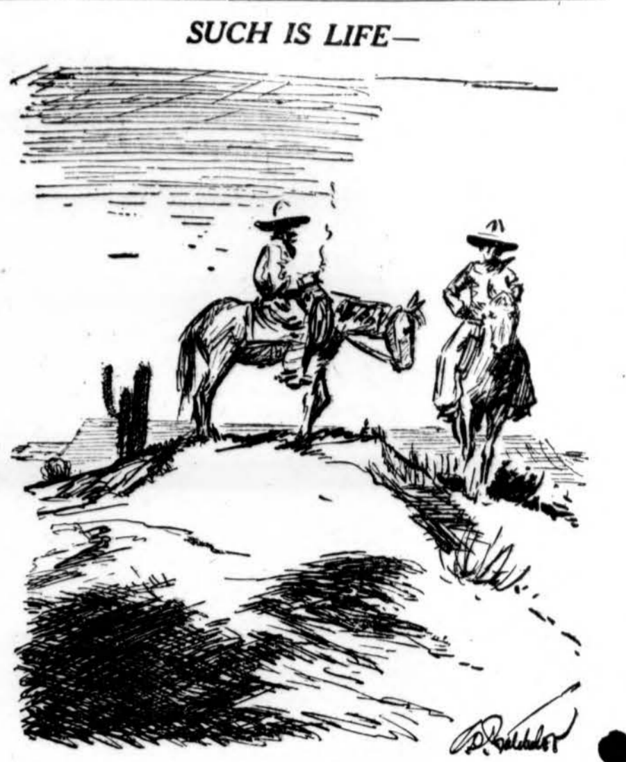
"Times aren't what they once was, Red; this country's gettin' overcrowded. Last week gon' the eighty miles into Las Vegas I met two men, a dude rancher and a dog."

Pipirų daugiau suvartojama tuose kraštuose, kuriuose jie auginami, negu tuose, kur eksportuojama.