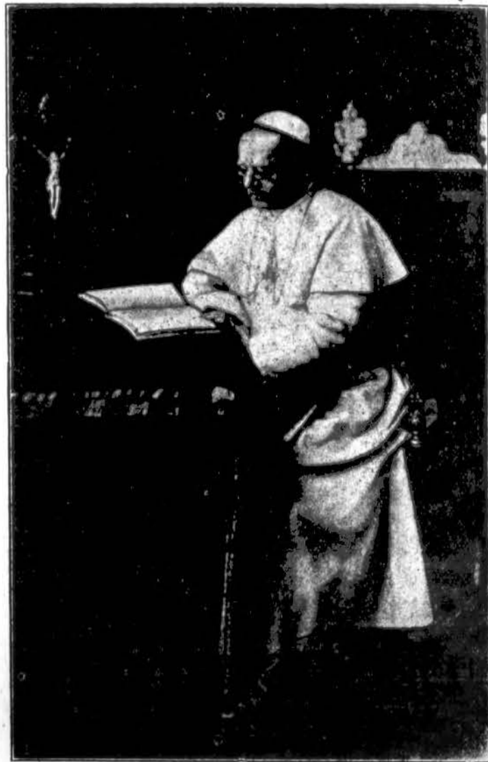
POPIEŽIUS PIJUS XI