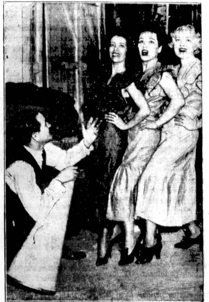
Metropolitan operos žvaigždės dalyvauja siurprizo pramoje vieno turtoolio pagerbimui. Išpildo "Minnie the Moocher" vieno akto džiazo dainas.

landžio 28 d., Liet. Auditorijoje rengia pramogą (bunco party) balandžio 3 d., tuojuo žinomą operetę "Pinafore". Lietuvių kalbon šį veikalą vertė Juozas Sauris.