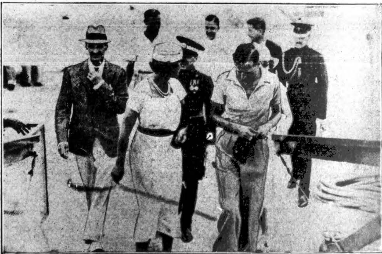
Kento princas su žmona svečiavosi pas prezidentą Rooseveltą Nourmahal jachte (laive), Bahama vandenyse. Iš kairės į dešinę: Bahamas gubernatorius Sir Bede Clifford, Kent princesė ir Kent princas.

Be Djevo meilės ir sta-vuomenės tvarka. Pamilk Die-vą, o rasi sau ir tėvynę, ne-nykstantą turtą. Kur Dievas ir knygos pirkti ir t.t. Pradė-ti ir palaima.