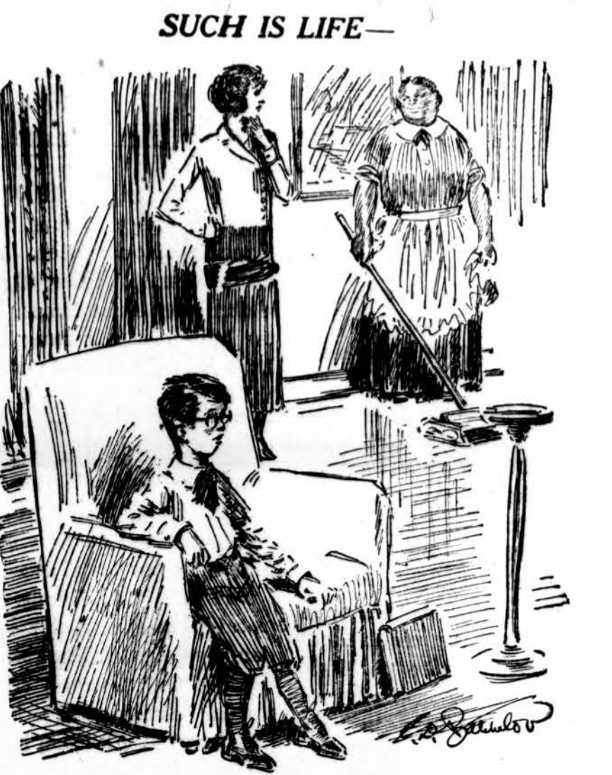
MANY A TRUE WORD IS SPOKEN IN ERROR. “You know, Dinah, Bertram was born after his father's death.” “Den, Mrs. Smiff, dat makes him one of dem post humorous chillen.”

pasisekimo labai daug prisidėjo Racine lietuviai, kurių atvaizavo apie 10 automobilių. Kilnios dvasios žmonės ir kitų gyvenimo padangę nušviečia ir sau skriaudos nepadaro.