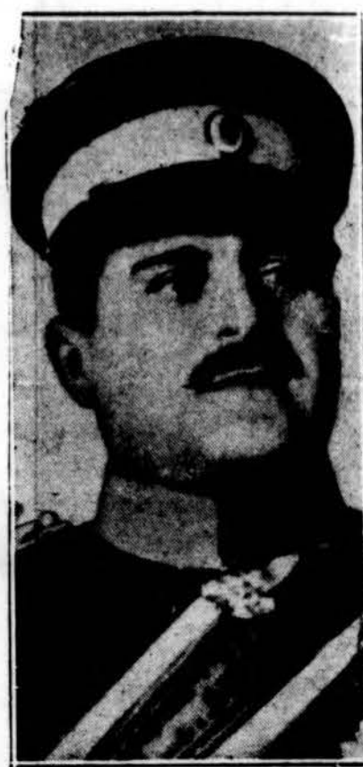
Gen. Tera Ziokovics, dabartinis Jugo-Slavijos karo ministris.

ms tikslams. Jis vertinamas sulig to, kiek ima darbo ir laiko jam padirbti bei kokian tikslui dirbamas.