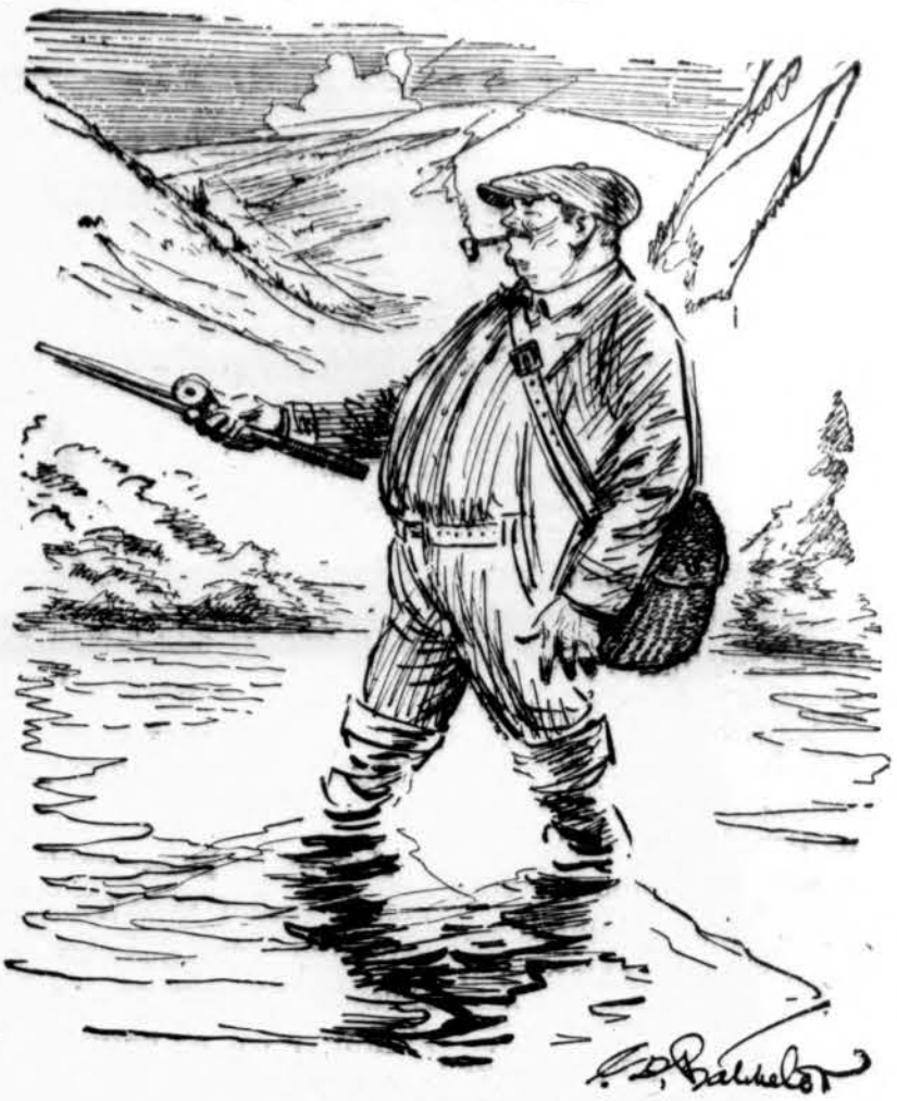
▲ BROAD CASTER