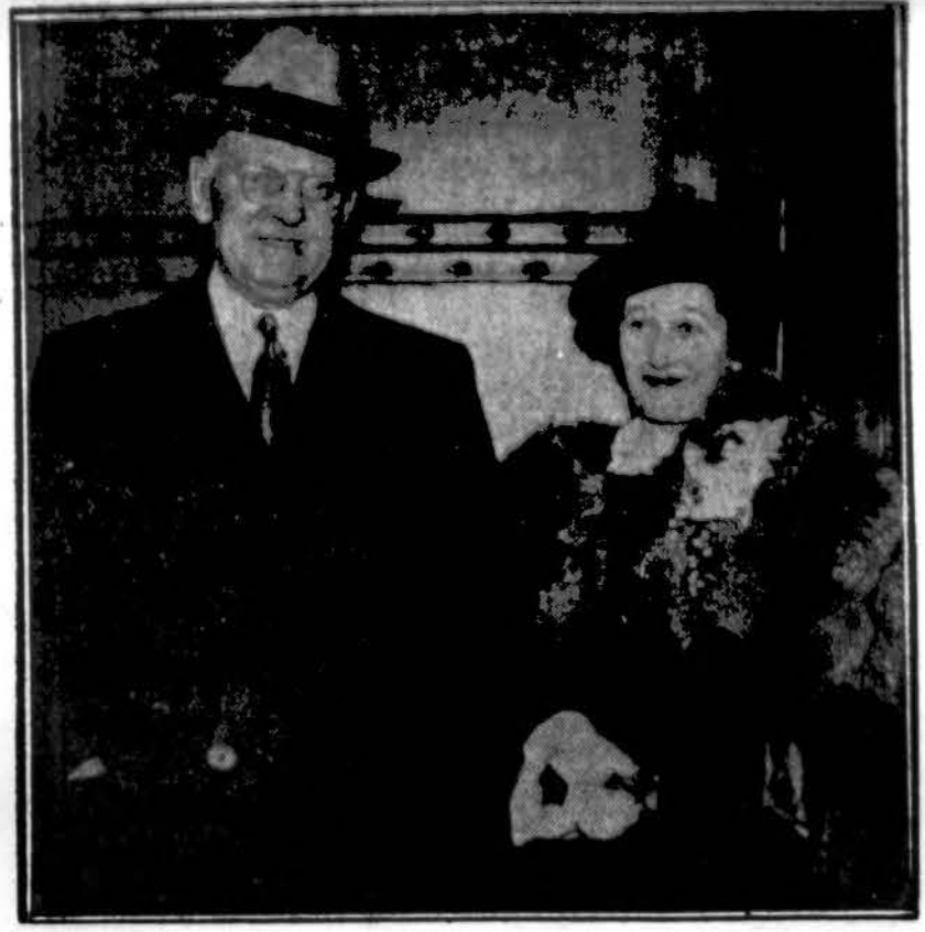
Chicago majoras Kelly su žmona. Abu išvyko atostogoms į Kaliforniją.