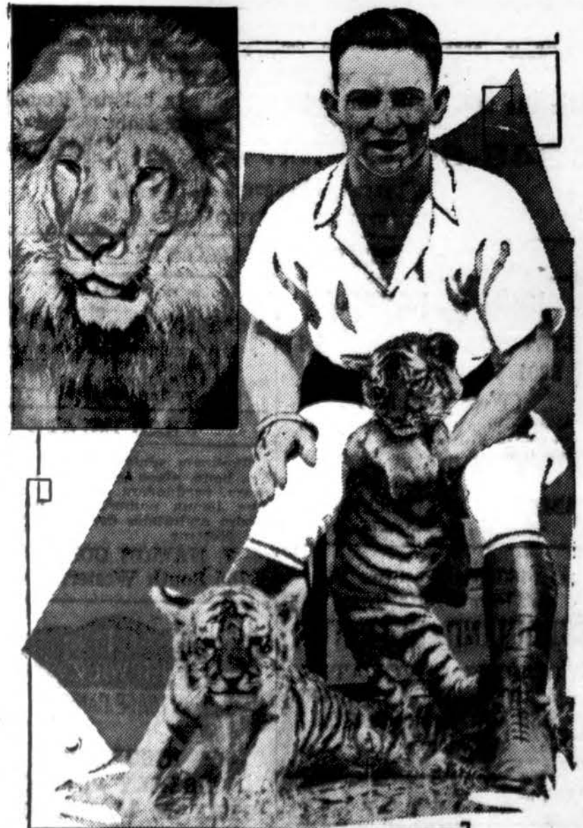
Čionai matote Clyde Beatty su tigras ir liūtais, kuriuos jis dresiruos kasdien, pradėdam balandžio 20 d., Coliseum, kur apsisotoje Cole Bros. cirkus.

Kas metų atvykimas cirkus pranašauja pavasarį. Cirkų žvaigždės, visokios idomybės, gražūs arkliai, laukiniai žvėrys, riešutai, lemonada, drambliai... viską bus galima matyti ir girdėti per 16 dienų.