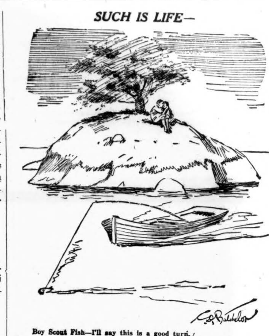
Boy Scout Fish—I'll say this is a good turn.

BINGHAMTON, N. Y. — Binghamton randasi gražioje apylinkėje. Gyventojų yra 100,000. Jų tarpe yra virš 500 ir lietuvių šeimynų. Čia lietuvių parapija susiorganizavo 1916 metais, kurios pirmu kle-