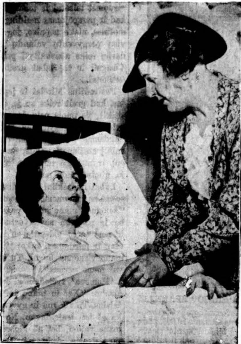
DANTIS VOS NEPAKIRTO GYVYBĖS