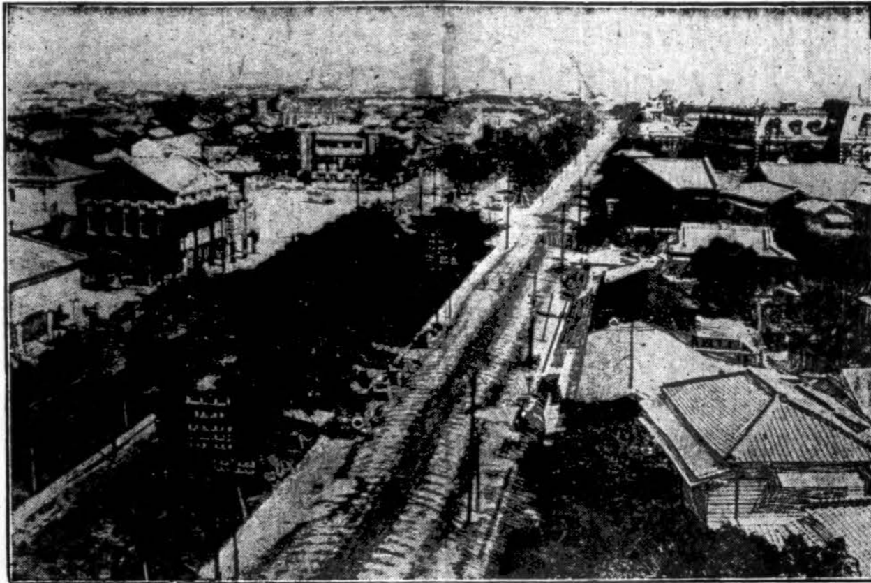
Cia atvaizduojama Taihoku miesto, Formosa saloje, svarbiausioji gatvė. Žemės drebėjimo katastrofa neištiko šio miesto. Jis stovi pačiam salos žeminiame gale. Drebinimas įvyko toliau pietų link.