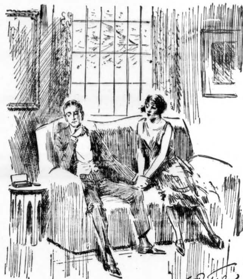
SNAP-SHOOTING THE MILLENNIUM "Oh! Gertrude, why didn't you tell me before that your dad is a millionaire? I just can't marry a rich man's daughter."