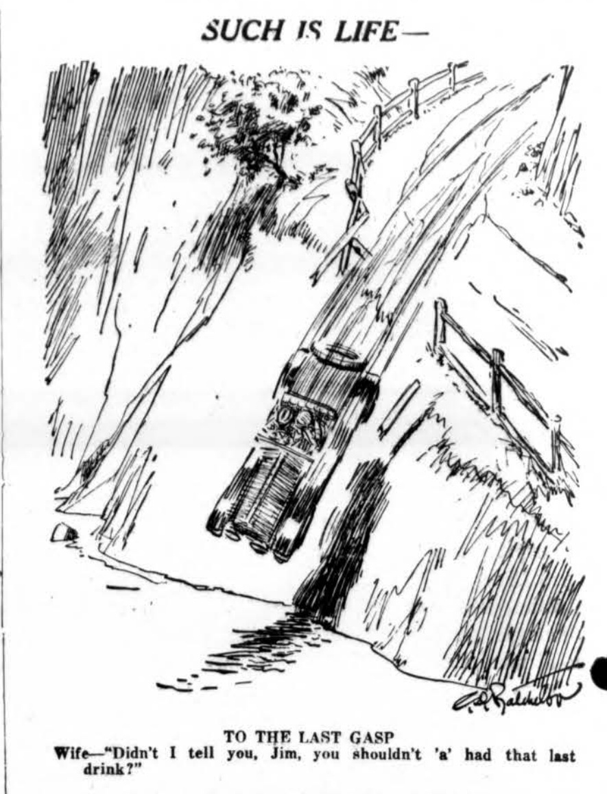
TO THE LAST GASP Wife—"Didn't I tell you, Jim, you shouldn't 'a' had that last drink?"