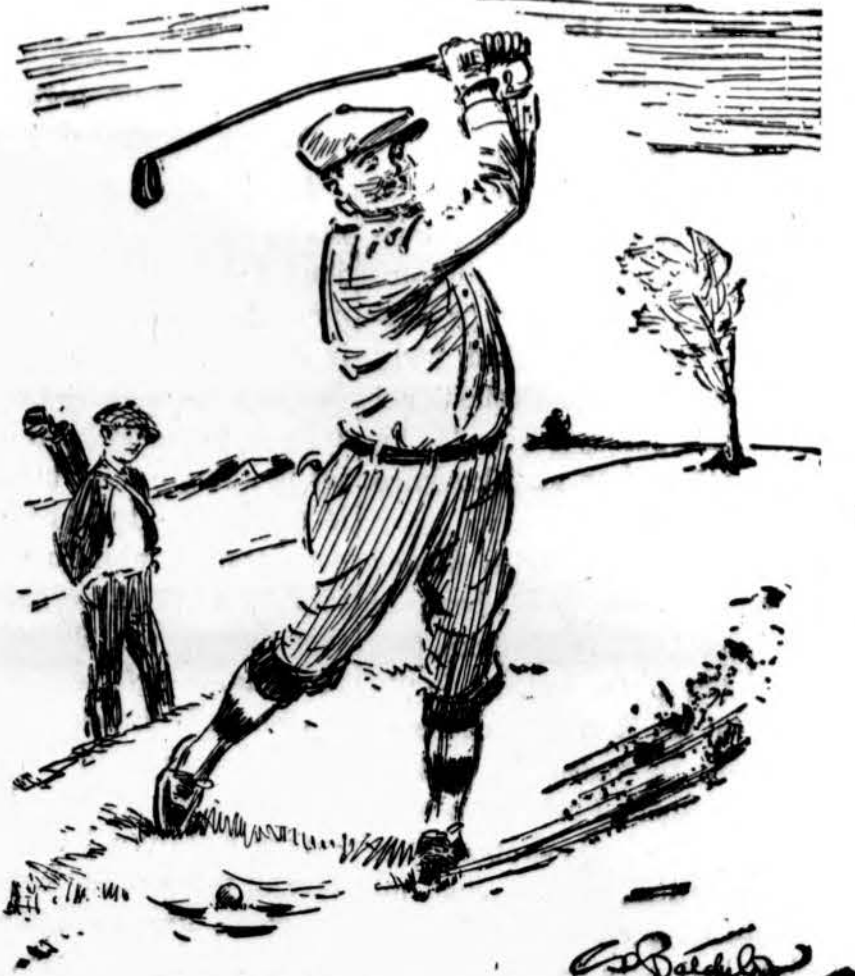
SNAP-SHOOTING THE MILLENNIUM... macey! How provoking!"