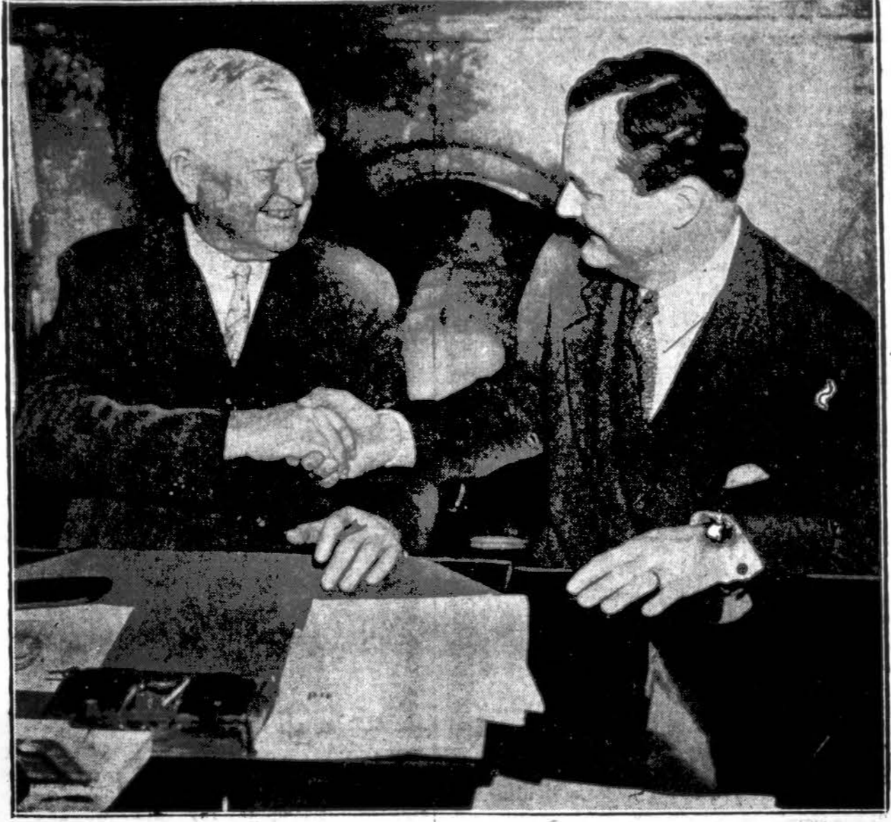
Viceprezidentas Garneris (kairėje) pasirašo karo veteranams bonusų bilių, kurį senatas pripažino. Ir podraug jis sveikina su bonusų pripažinimo laimėjimu šio biliaus autorių, kongresmoną W. Patman iš Texas. Prezidentas Rooseveltas šiandien paskelbs savo veto šiam biliui.