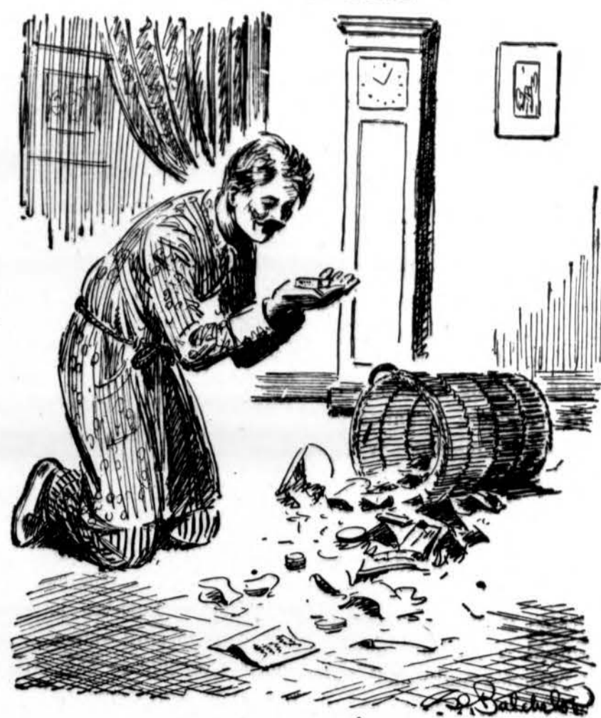
GIRLS YOU CAN'T FORGET When you renounced her last night and threw a perfectly good package of cigarettes in the basket Lady Nicotine knew you would find them this morning.