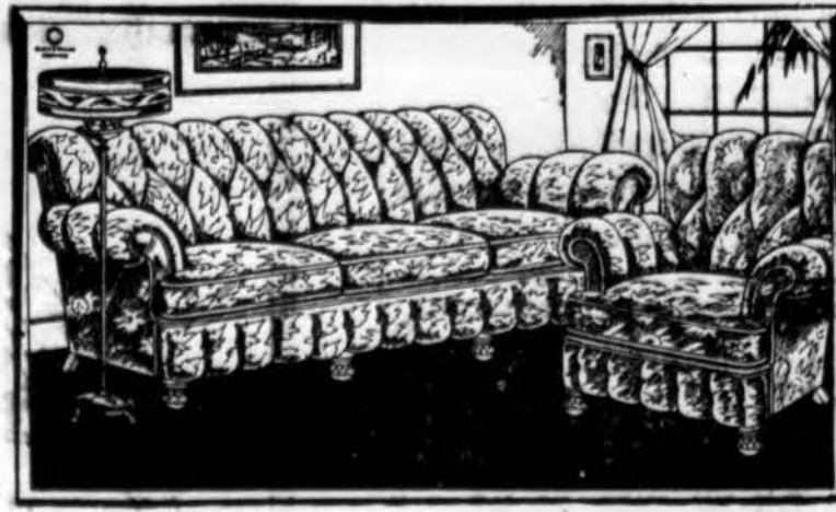
Parlor Setas $140.00