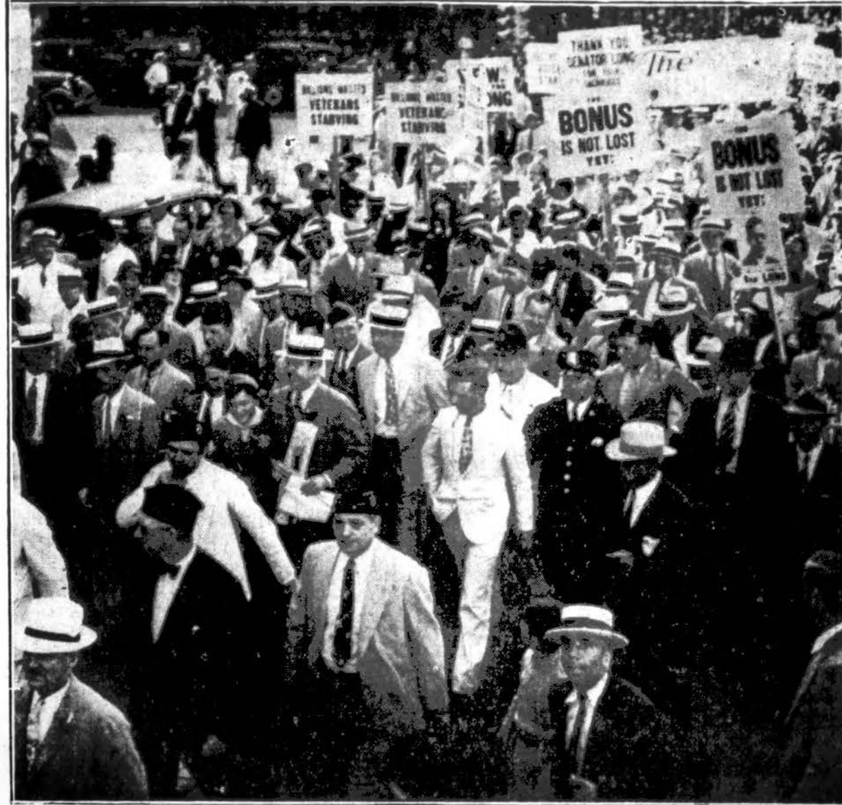
Karo veteranai tokiomis vaikštyne mis ir demonstracijomis pasitiko iš Washingtono parvykusį į New Orleans miestą, La., senatorių Long, kurs daug dirbo senate už bonusus. Senatorius matomas centre, turįs rankoje laikraštį.