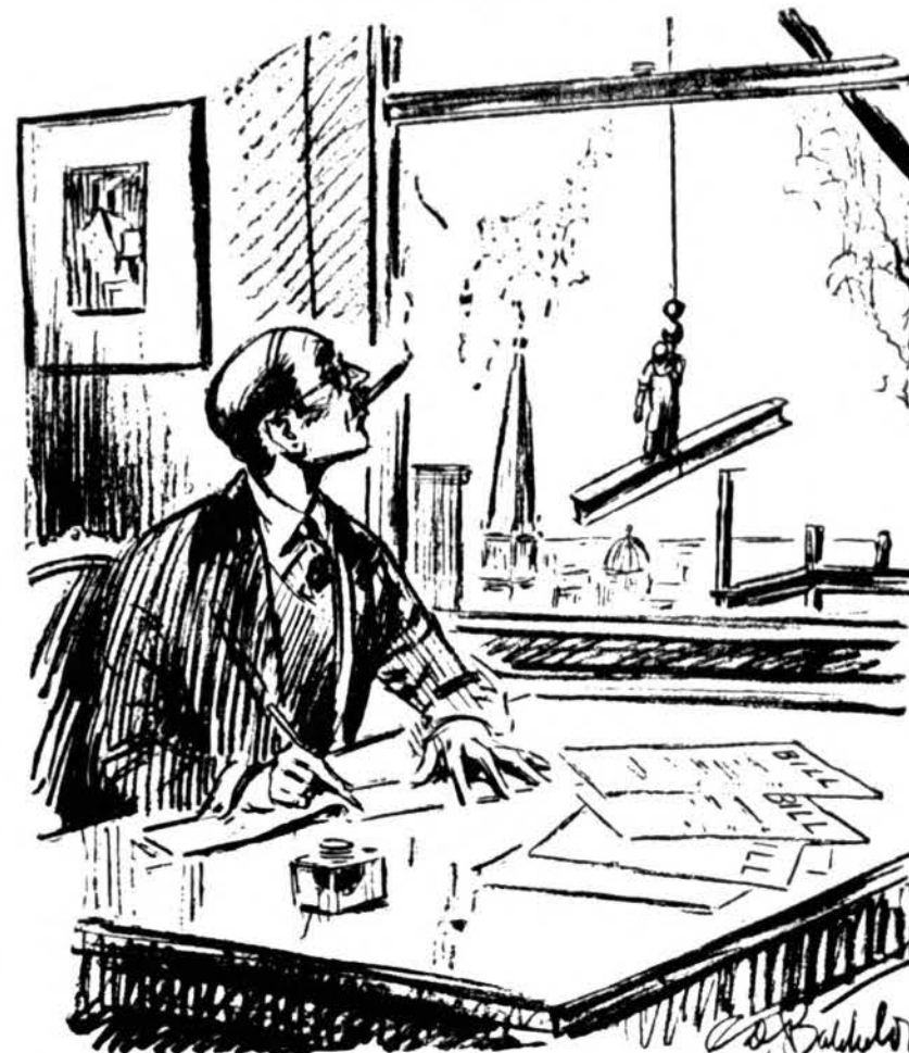
THAT FELLOW FEELING WHEN THE CHRISTMAS BILLS COME DUE

na pasakytį lakūnui Vaitkui ris yra keletas tomų. Jų yra good bay. Grižo namo nosis dvejose rūšys, vienį iš Indijos, nuleidę, nes nematė Vaitkai, kiti iš Afrikos.