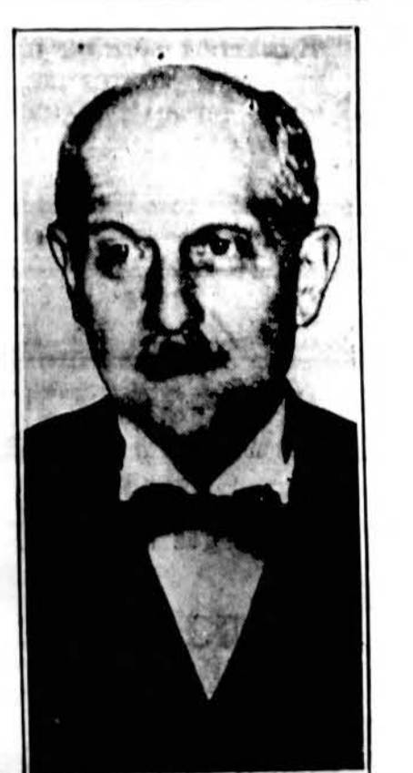
Francois Pietri, buvęs Pranešijos karo laivyno ministras, kuris prezidento Lebrun pakviestas sudaryti naują ministrų kabinetą.

Palyginus paskutinių trejų metų Lietuvos išvežimo davinus, gauname šitokį vaizdą. Javų Lietuva į užsienius išveža: