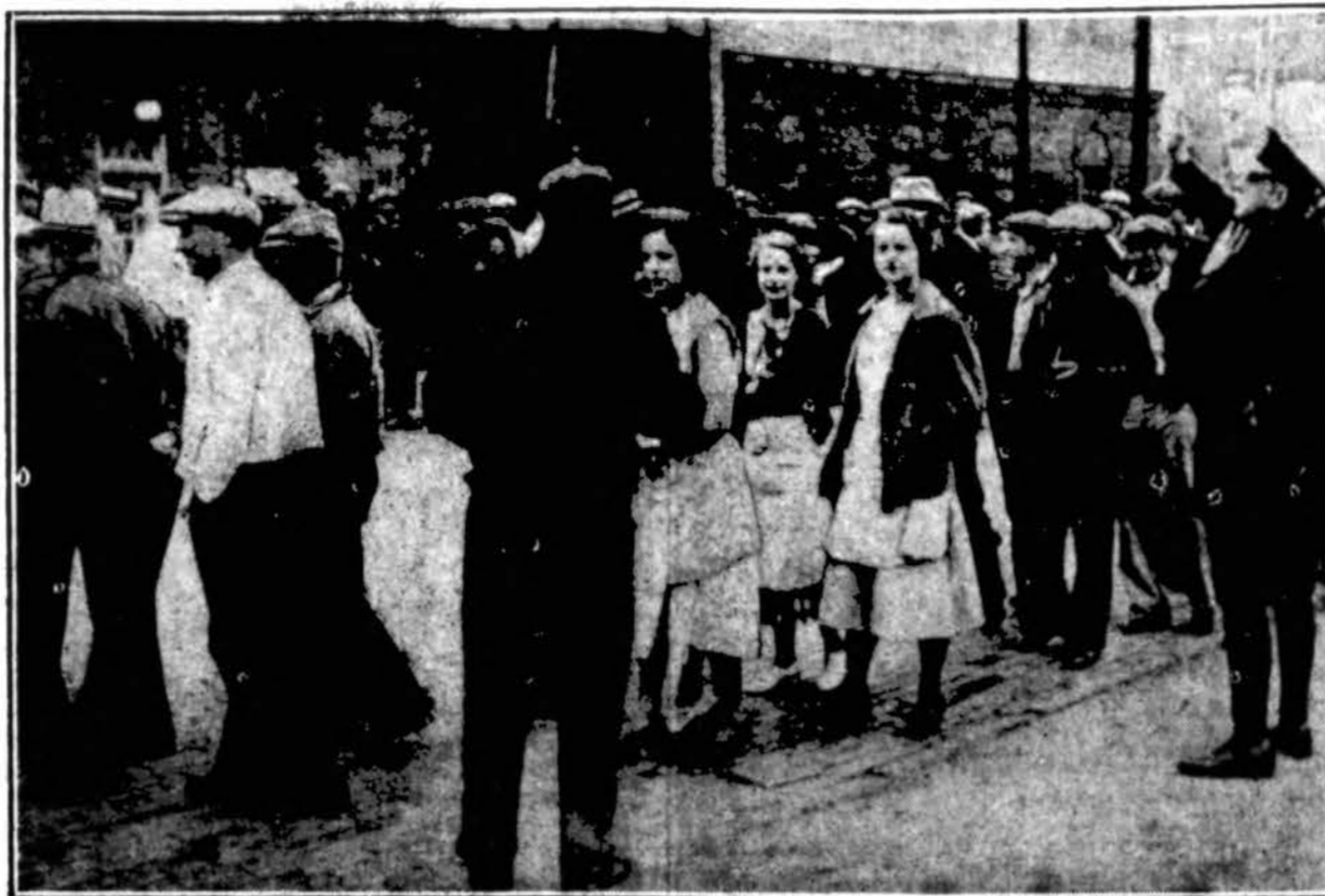
Vaiduojama, kaip streikuojantieji darbininkai pikietuoja Toledo Edison kompanijos elektros gaminimo svarbiausią stotį. Streikas iš pradžių pakirto pramonę mieste. Paskiau gauta iš kitur elektros pajėgos fabrikams.