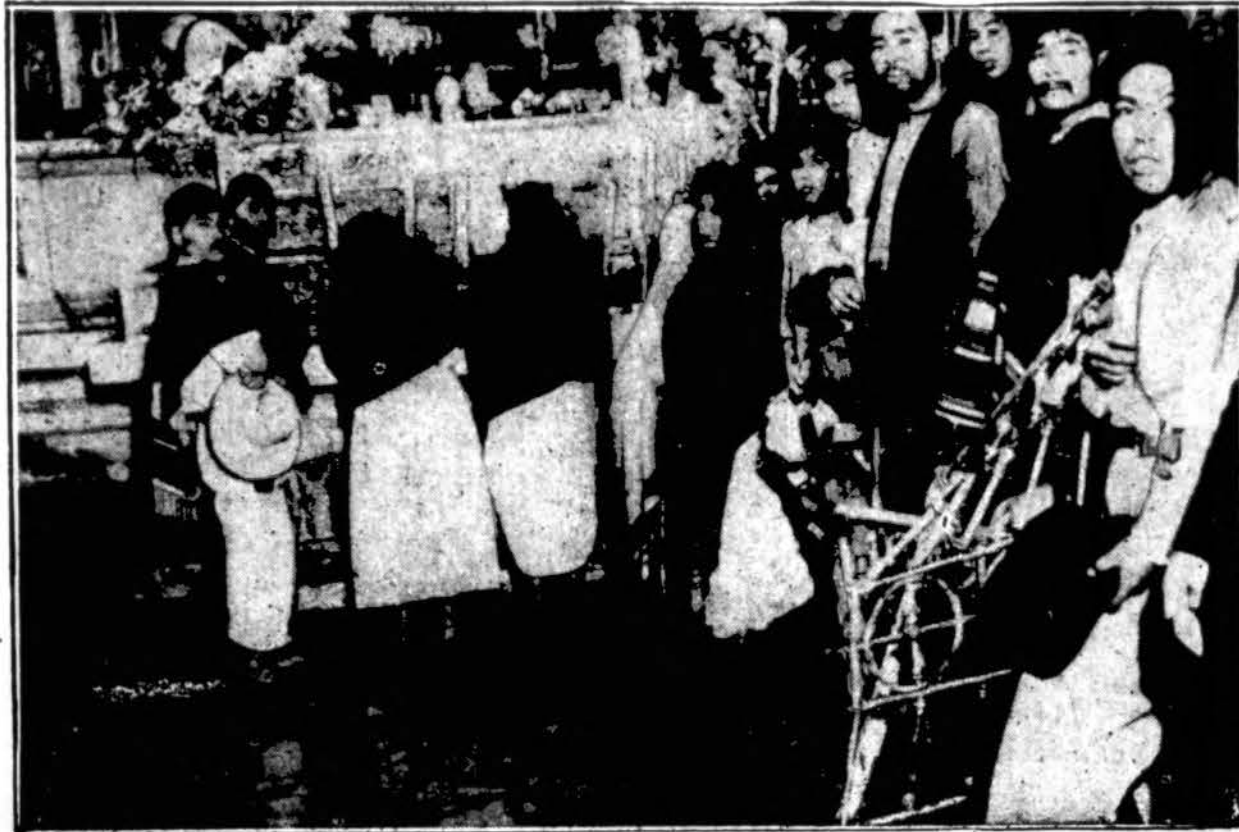
Netikėtai užtelėjusios nuo kalno milžiniškos vandens bangos sugriovė bažnyčią San Pedro Actopan miestelyje, Meksikoje. Tos katastrofos metu bažnyčioje buvo keletas šimtų asmenų, iš kurių daugiau kaip 300 žuvo. Tarp žuvusiųjų žymi dalis vaikų ir moterų. Čia vaizduojami išlikusieji asmenys, sustoję prieš didįjį altorių sugriautoj bažnyčioje.

SIMTAI ASMENŲ ŽUVO BAŽNYČIOJE, MEKSIKOJE