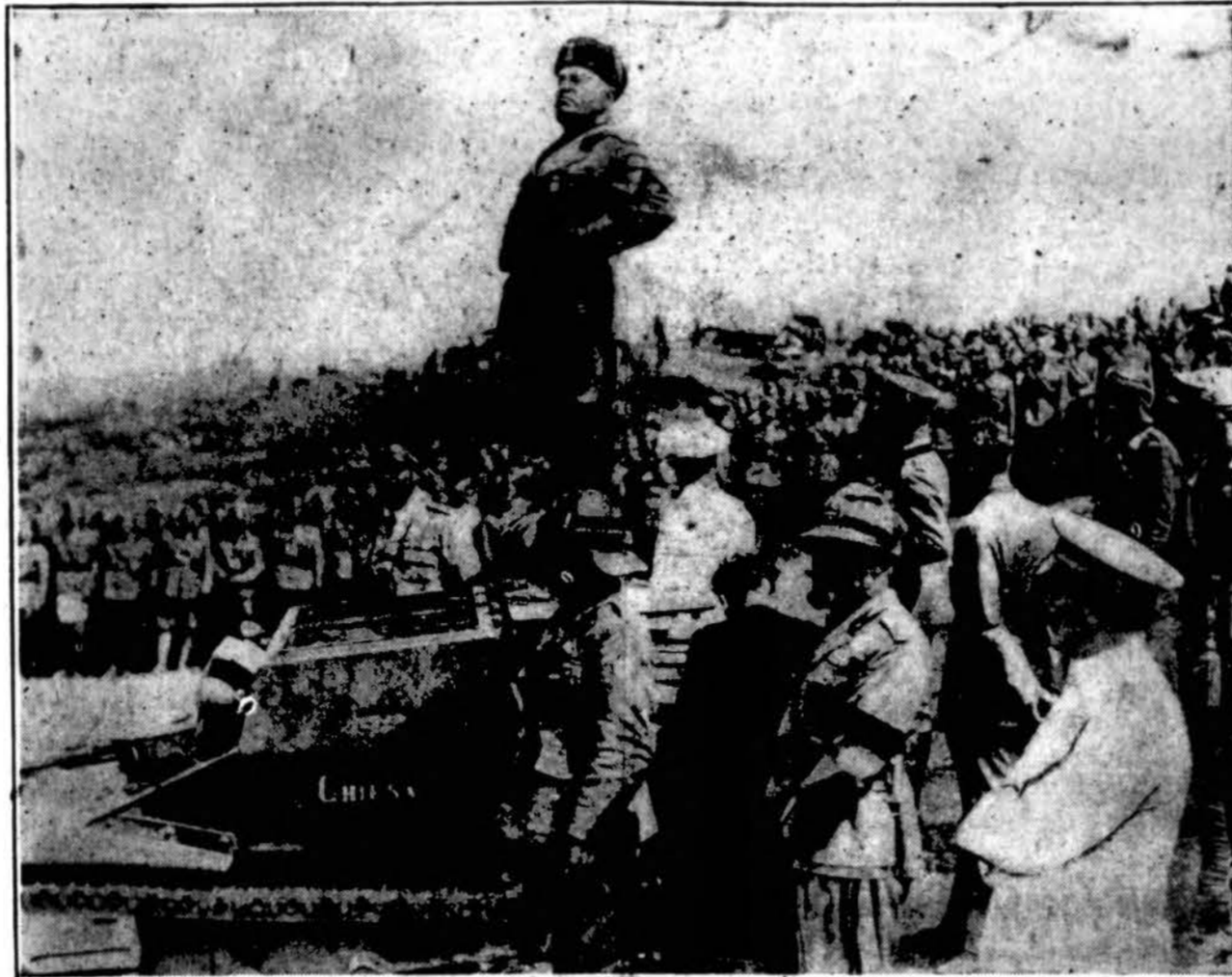
Italijos premjeras Mussolini sako prakalbą kareiviams Cagliari, Sardinijoje. Jis pažymi, kad Italija nepakę, jei Anglija kišis į Italijos ginčus su Etiopija (Abisinija).