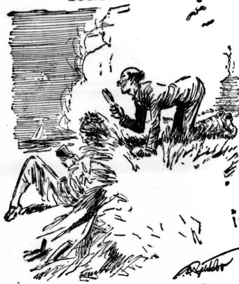
"Ah! Ha! Some rare Flora in a new habitat."

gos ir apylinkės parapijos cho-rai, vedami vedėjų - vargoni-ninkų.