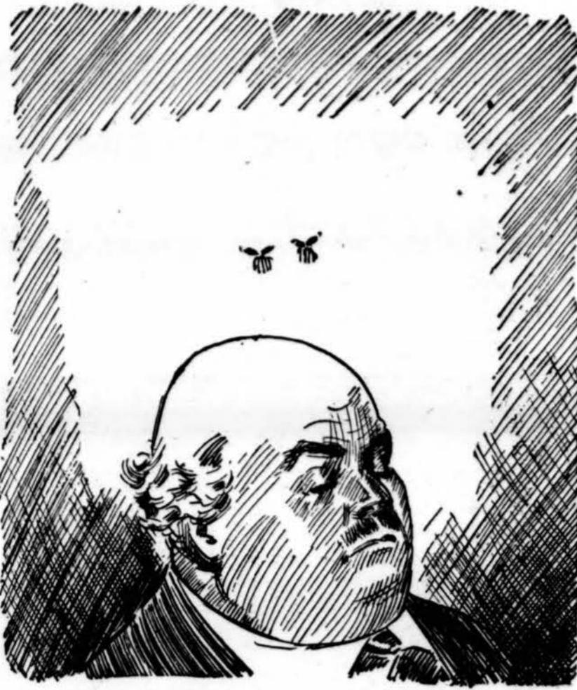
"A Mosquito—And that barren tract, my son, just below us is the great American desert."