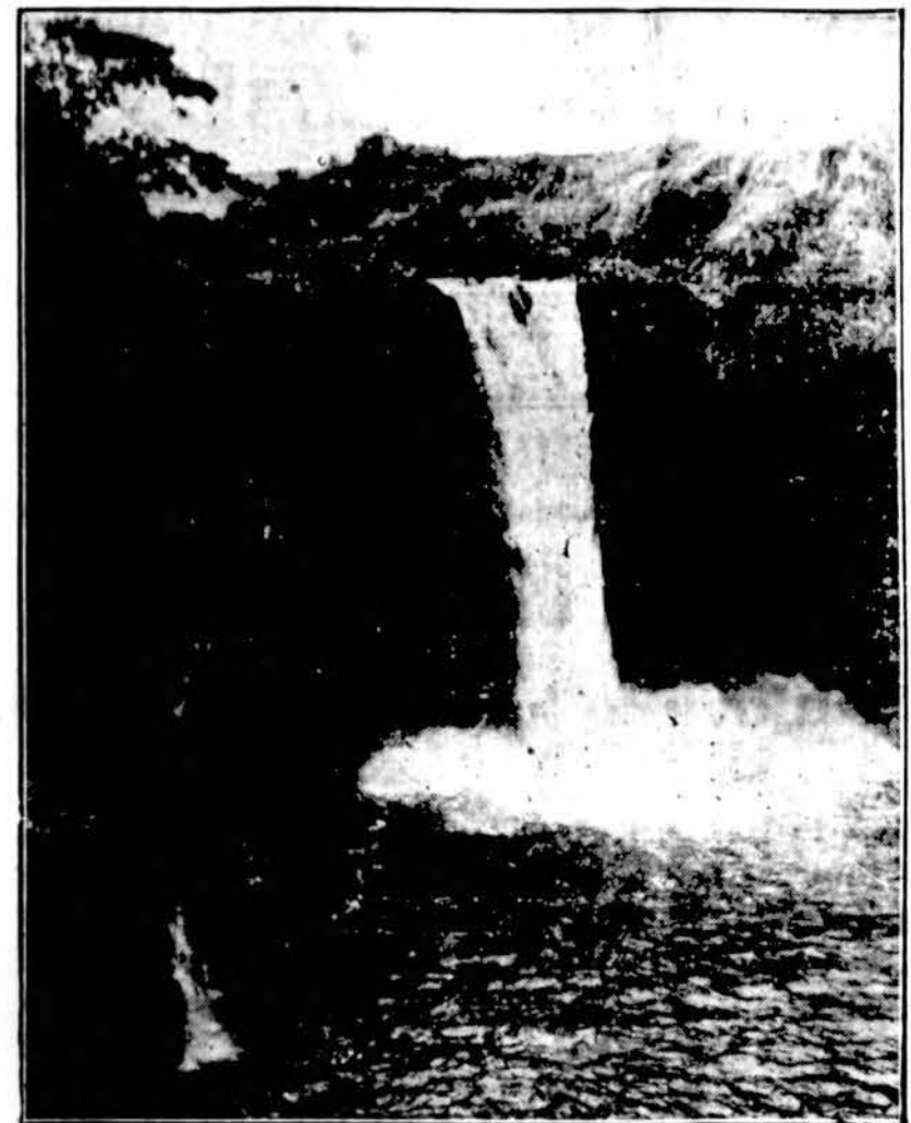
Havai salų "Niagara". Vaizdas iš... vanden-puolio Havai salose, turistų mėgiamiausia vieta. Van-dūo krenta iš 75 pėdų aukštumos.

Galingas Jungtinių Ameri-kos Valstybių laivynas nedėl-