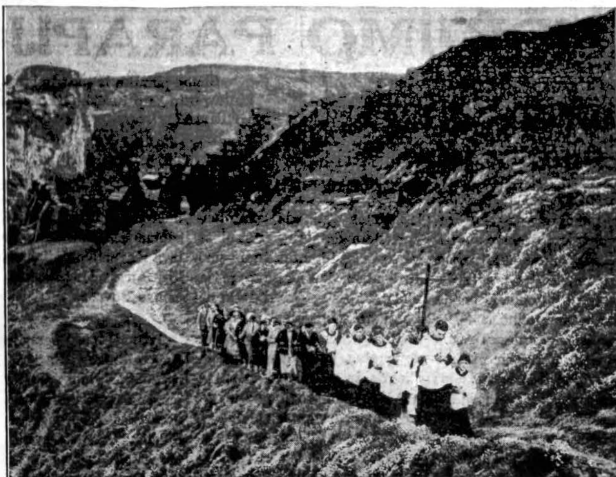
Kai kuriuose kraštuose iš senovės yra užsilikęs gražus paprotys laiminti laukus ir juose derlius. Čia atvaizduojama, kaip Anglijose tas gražus paprotys vykdomas. Su procesija laiminami laukai, žukla ir kasyklos.

Birž. 16 d. parap. svetainėje buvo parap. mokyklos mokslo metų užbaigimas. Vakare 8 val. išpildyta gražus programos. Visų mokyklos skyrių mergaitės ir berniukai kuopuikusiai savo užduotis išpildė. Matyti, mokytojos Sv. Kazimiero seserys turėjo daug