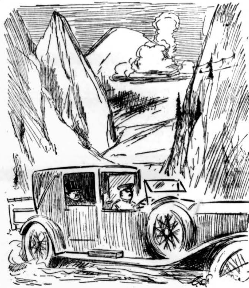
Does nature work a thousand thousand years for:

silpniau, jis pasidėdavo kaip vaikas savo galvą ant mano krūtinės ir kartodavo: "Jėzau, Marija! — ir karštai pabučiudavo kryžių. Kartas nuo karto kreipdavosi į esančiuosius: "Aš myliu Dievą ir žmones. Tokia jo valia, kad aš taip mirėčiau. Mano brangioji sesute, neverk. Aš mirštu. Melskitės už mane. Sudiev, iki pasimatymo danguje".