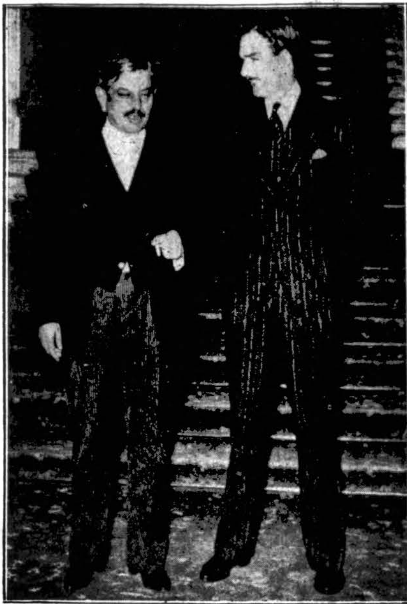
Prancūzijos prenjeras Lavalis (kairėje) ir Anglijos spencialus keliaujantis ministeris kap. Edenas. Pastarasis neseniai lankėsi Paryžiuje ir Romoje aktualiais tarptautiniais reikalais.