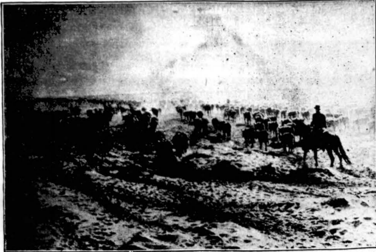
Galvijus migruoja į kitą valstybę -- Vienas Texas gyvulių augintojas savo didelę bandą varo į šiaurinę New Mexico valst. dalį, kur randasi geresnės gavyklos. Galvijai turėjo padaryti 225 mylias kelio.

Visaip figeriavo, figeriavo ir vis tik neišfigeriavo kaip užsidėti salotų farmą. Jam "Tetytė" žadėjo nupirkti šimtą akrų žemės, po kvoterį akrą, ale pasirodo kad ta žemė kur tai kalnuose, kur nei