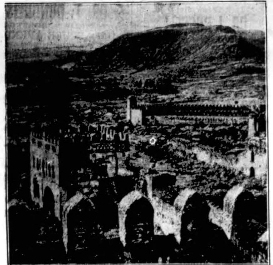
Etiopijos senovės liūdytojai. — Senovės Etiopijos sostinės griuvėsiai. Iš tų mūrų per šimtmečius buvo valdomas kraštas, kurį labai italai nori užgrobti.