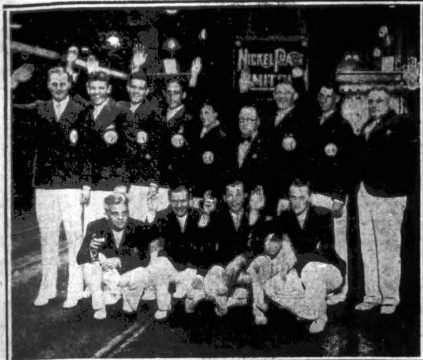
Grupė Chicagos lietuvių atletų, užvakar išvykusių į Lietuvą dalyvauti viso pasaulio lietuvių kongreso olimpiadoje Kaune. Paveikslas nutrauktas La Salle stoty prieš sėsiant į traukinį.