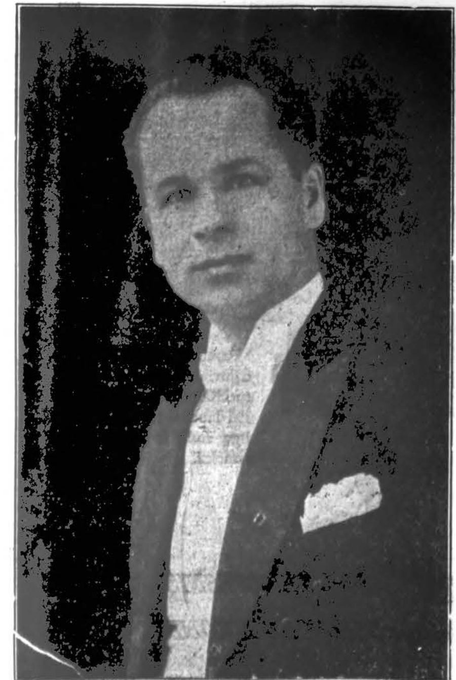
Art. J. Kudricka, varg. Nek. Pras. P. Š. parapijos, kuris dideliu atsidejimu ruošia savo chorą Dainų Šventei, rugp. 4 d., Vytauto parke.