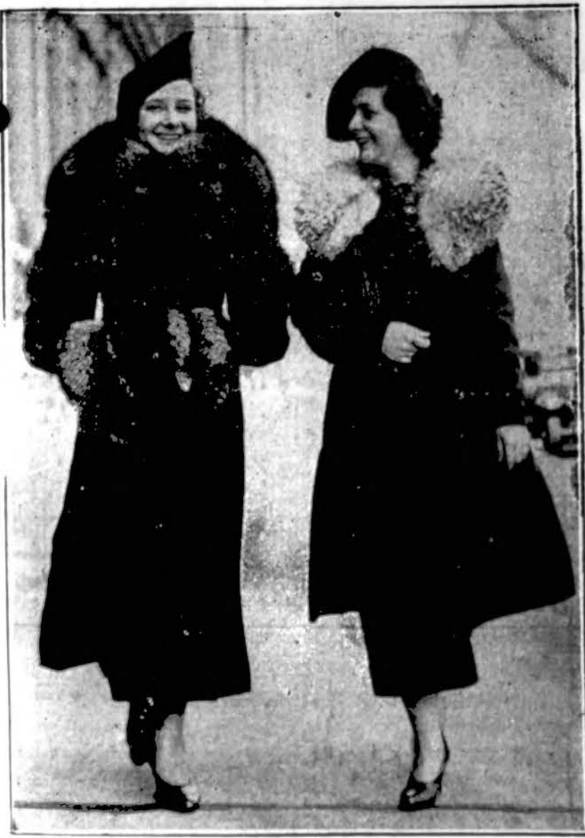
Moterų dėmesiai. — Šios gražuolės demonstruoja ateinančių rudens moteriškų drabužių madas.

"DRAUGAS" 2334 So. Oakley Av. CHICAGO, ILL.