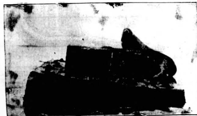
Jūrų liūtas Michigan ežere. — Šiomis dienomis Michigan ežere netoli Gary, Ind., pastebėta ši "pabaisa" — jūrų liūtas. Manoma, kad į ežerą bus patekęs iš kurio nors žvėrinčiaus.

Tverdamas muziką vokiečiams, žūri, kas jų ausiai geriausia atatinka. Nuvykęs Italijon, ištiria italų ausį. Ir paskui jon skambanėias savo melodijas taiko. Grįžta Prancūzijon, daro taip pat. Nekartą čielą glėbelį išteklių išaikvoja pirm negu sa-