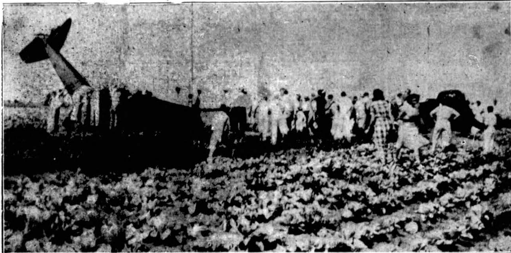
Stinson airporto padangėse susidaužė (kolidavo) du lėktuvai ir abu nukrito. Iškart vienas asmuo žuvo ir trys kiti sužeista. Paskiau mirė dar du iš sužeistųjų. Matosi susibėgę žmonės aplink nukritusius lėktuvus. Stinson airportas yra arti Lyons.