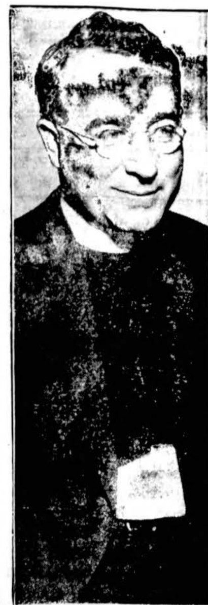
Svečias. — Kun. Charles E. Coughlin, iš Detroit, Mich., pagarsėjęs visoj Amerikoj kalbomis per radio, užvakar atvyko į Chicagą.

Indijos vaikeliai neatsilikė nuo Europos broliukų ir sesučių. Per stiprybę, kurių gau-