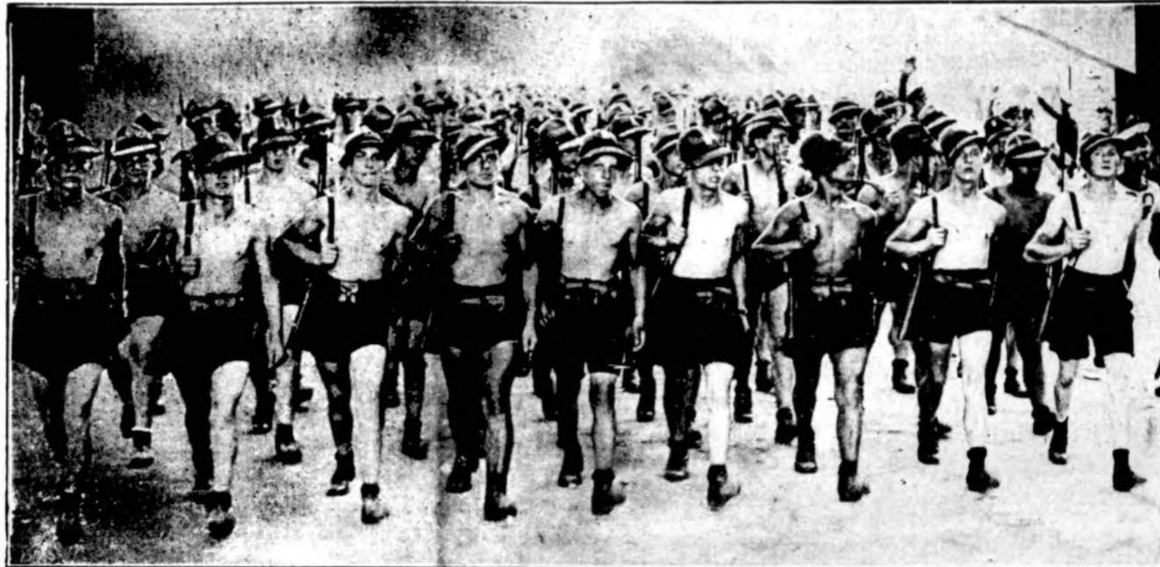
Prieš siūsiant į Afriką italų kariai namie užgrūdenami, kad jie apsiprastų su dideliais kaitromis, kurios siaučia kolonijose išilgai Etiopijos pasienio. Tos rūšies "išlaikomybės" pratimai vykdomi šalia Romos ir kitur.