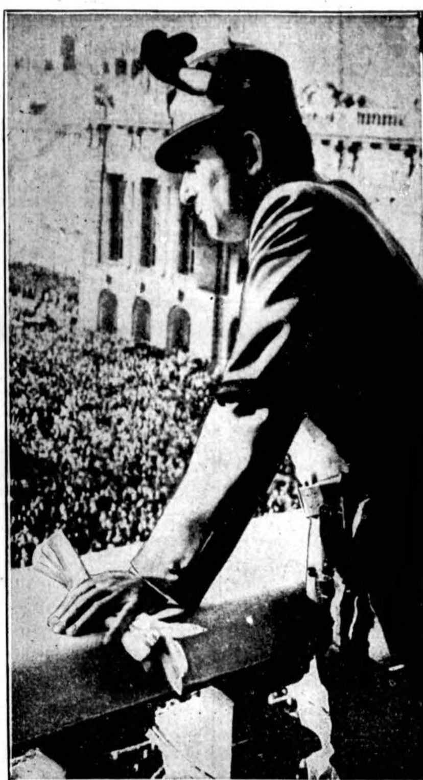
Mini kancl. Dollfuso sukaktį. — Austrijos vice kancleris, princas Starhemberg, kalba Vienoj tūkstantini miniai metinėse nuo kancl. Dollfuso nužudymo sukaktuvėse.

1801 S. ASHLAND AVENUE Platt Bldg., kamp. 18 St. 2 aukštas Pastebėkit mano iškabą Valandos nuo 9:30 ryto iki 12 v. Popiet nuo 1:30 iki 8:00 val. vakaro. Nedėliomis nėra skirtų valandų. Room 8. Phone CANal 0523