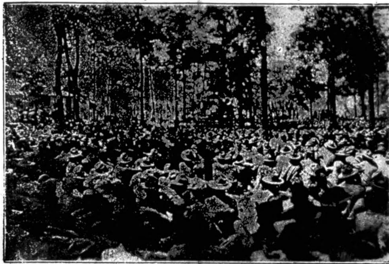
Atvaizduojama dalis vizitorių, kurie šį sekmadienį buvo supildę į Grant stovyklą, šalia Rockfordo, Ill., kur vasaros pratimams apsisotė 6,000 valstybės milicininkų (karių). Vizitoriams buvo sakomos prakalbos.