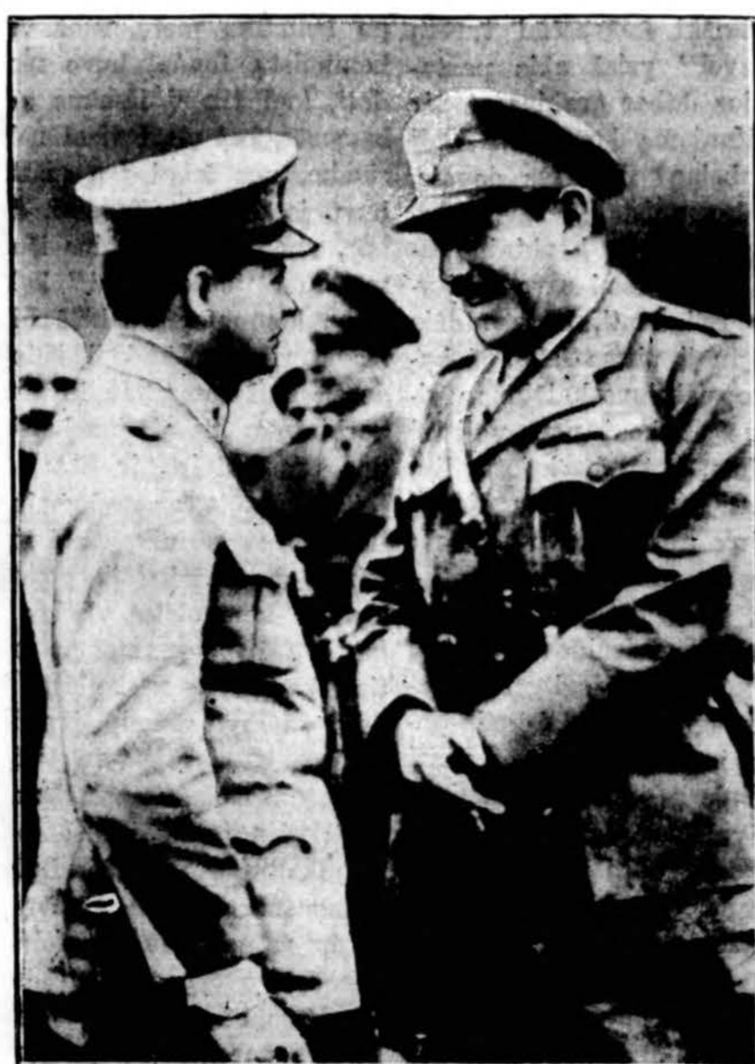
Buvę priešai susitiko. Gen. Jose Estigarribia (kairėj), vyriausias Paraguay kariuomenės vadas, ir gen. Enrique Penarando, komendantas Bolivija kariuomenės Puesto Marino taikos konferencijoje susitikę akys į akis draugiškai kalbasi.