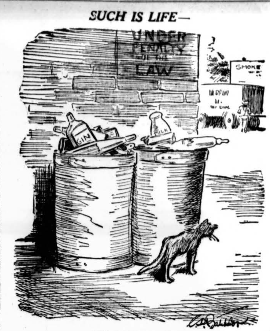
TWO MORNINGS AFTER