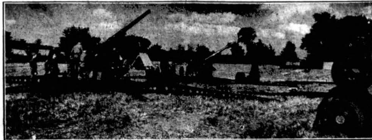
Pine Camp, N. Y., apylinkėse prasidėjo U. S. kariuomenės manevrai. Pirmoji grupė sudaro 34,000 karių. Čia rodomos patrankos, kurios nustatytos kovoti puolėjus iš oro. Patrankos priklauso pakraščiu artilerijai.