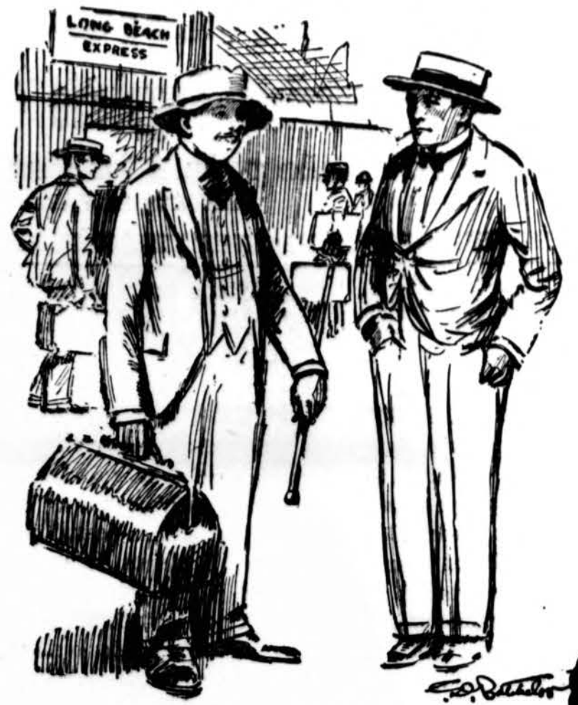
WITH THE SEA THERE'S ALL THE TIME "It's a great time at the shore. Won twelve bucks at bridge, danced thirty-eight miles and drank fifty-eight p-p-vaz Scotch highballs."

Gyvasai paveikslas, vaizduo-jas Dariaus ir Girėno žuvimo tragediją. Dalyvavo vaidinto-jai, solistai, chorai ir orkes-tras.