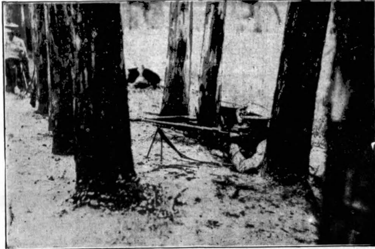
Saugoja sieną. Moderniškoji etiopiečių kariuomenė pasiruošusi gintis nuo priešo — italų, kurie geriausias karo jėgas koncentruoja Afrikoj.

Iškilmišė baigtos, bet išpūdis neišdils ilgai, ilgai... Pilnomis pagarbos akimis lydi tikintieji Ganytoją. Jis maloniai pasivieši pas Lietuvos Šv. Kazimiero seseris. Juk jos visiems lietuviams brangios. Kiek daug jos jaunų, gležnių sielų paruošia gyvenimui, kaip stropiai jos dirba gimnazijoje, kame mokosi per 500 mergaičių; kaip sekmingai jos auklėja vaikučius pradžios mokyklose Pažaislyje, Kaune, A. Panemunėj, Telšiuose ir Ze-