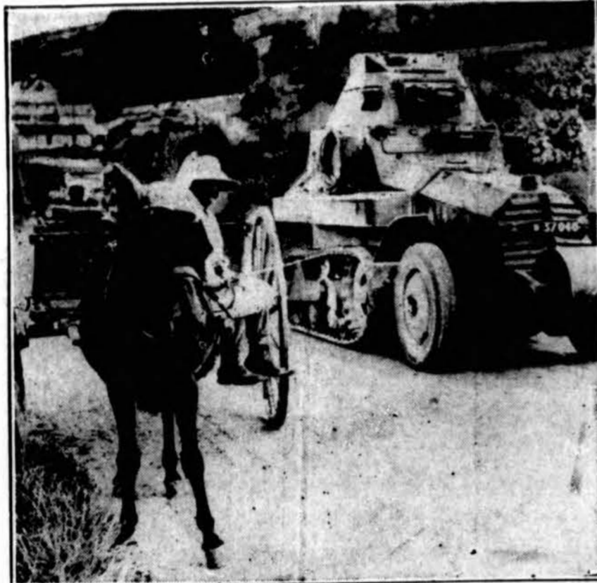
Ši nuotrauka padaryta per neseniai įvykusius Prancūzijos karo manevrus. Šiais manevrais prancū- zai išbandė mekanizuotas karo mašinas. Čia matomas vienas šarvuotas automobilis, o šalia jo ratuose prancū- zas ūkininkas. Muliukas atrodo visai ramus prava- žiuojant tam karo siaubui.