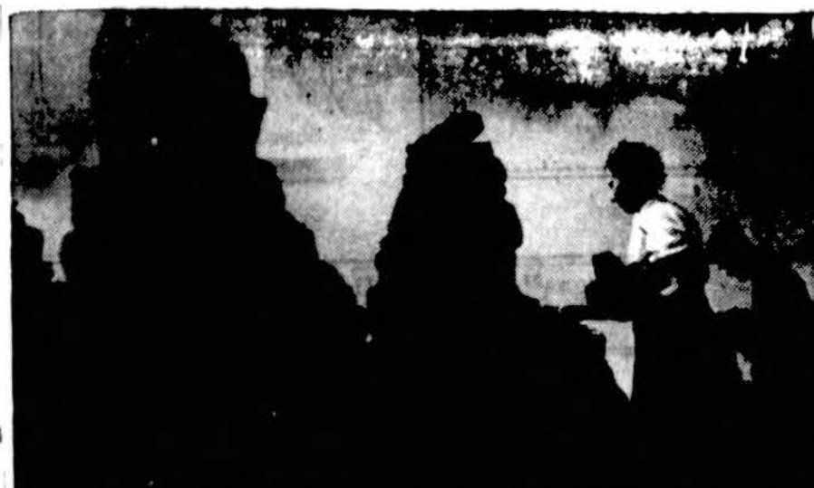
Lietuvos dūrpės. Sakoma, kad dūrpės, tai Lietuvos tur-tas. Dūrpių dabar Lietuvoje daug kasama ir jos labai geros yra kuras, kuriomis daugelis gyventojų naudojami, vietoj ma-lkų ar anglių.

Tiesa, mūsų istorikų ši sri-tis mažai iširta, bet jau vie-nas tas faktas, kad gražiausiais lietuvių tautos žydėjimo laikais, kada Lietuvos valsty-bė viešpatavo nuo Baltijos iki Juodųjų jūrų, nevengtą savo pavaldinių — gudų kalbos ir net rašto... Pakanka tik pava-žuoti aplink Vilnių arba net Latvijoje už Daugavpilio, ne-toli latvių, rusų ir lenkų ru-bežias, apie Indriekų. Skais-tą, ir pamatysime, kad tą is-torinę klaidą ne vien Liublino unija padarė, darė ją ir Lietuvos žydėjimo laikai. Mi-nėtose vietose dar ir dabar tikrų lenkų nelengva surasti, bet jų esama, ir dar kiek, nes katalikai gudai kone visi pa-liokais save vadina, nors dau-gelis kalba tik gudiškai; o drauge, kaip ir mūsų sulenkė-jė miestelėnai, neapkenčia lie-tuvių dažnai bjauriau už tik-ruosius lenkus. Panašių atsi-tikimų yra ir su pačiais lie-tuviais, nors žymiai rečiau. Tuo tarpu likę ir dabar tik-rieji baltgudžiai daugumoje su tikraisiais lietuviais sugyvena gražiuoju. Ar dar reikia ge-resnės ironijos! Kur kalbini-nykų, archeologų ir istorikų ži-niomis anais laimingaisiais lietuvių tautos ir valstybės lai-kais buvo pats lietuvių židi-nys, ten dabar susėjusios kei-lios kultūros ir net kalbos pe-reiti. Ir nenuostabu: laisva valia mums pasidavus baltgu-džių įtakai, nesunku buvo ir lenkams gražiuoju įsipašyti, ypač anais kultūrėjimo ir kri-tikšioninimo laikais, o įsipašius ir mūsų bajorijoje įsigy-venus lenkų tradicijoms, dar lengviau ir rusų ir vokiečių, ar tai kultūrai, ar tai bent pa-