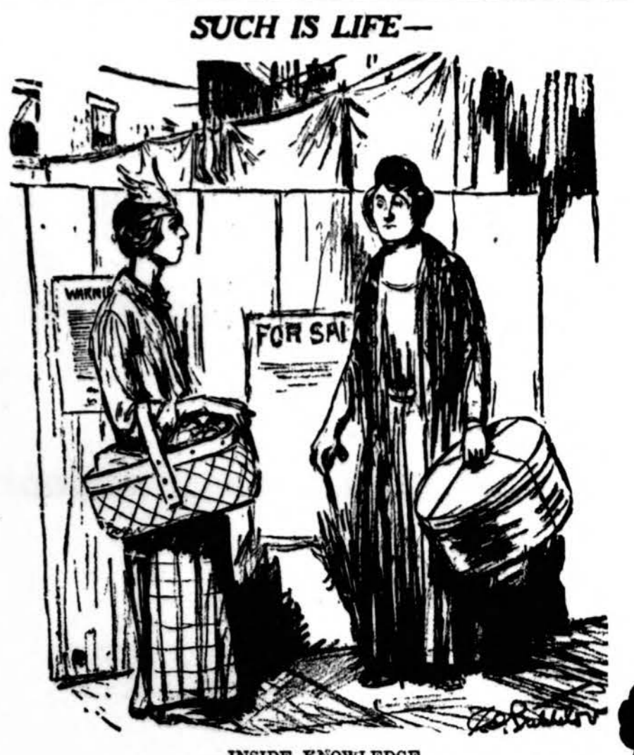
"Do I know Mrs. Smith-Brown Glendening? 'I'll say I do, 'r maid's been a chum o' mine for goin' on to four years."

BRIDGEPORT. — Daugelis šios kolonijos lietuvių praėjusią savaitę rengėsi sekmdienį vykti į Labdarių ūkį, kur turėjo įvykti "Draugo" darbininkų, agentų ir rėmėjų piknikas. Apgailestavo, kad lietus viską sugadino. Dabar džiugiasi, kad parengimas nukeliamas į ateinantį sekmdienį. Jei diena bus graži, tai daugelis vyks į Labdarių ūkį.