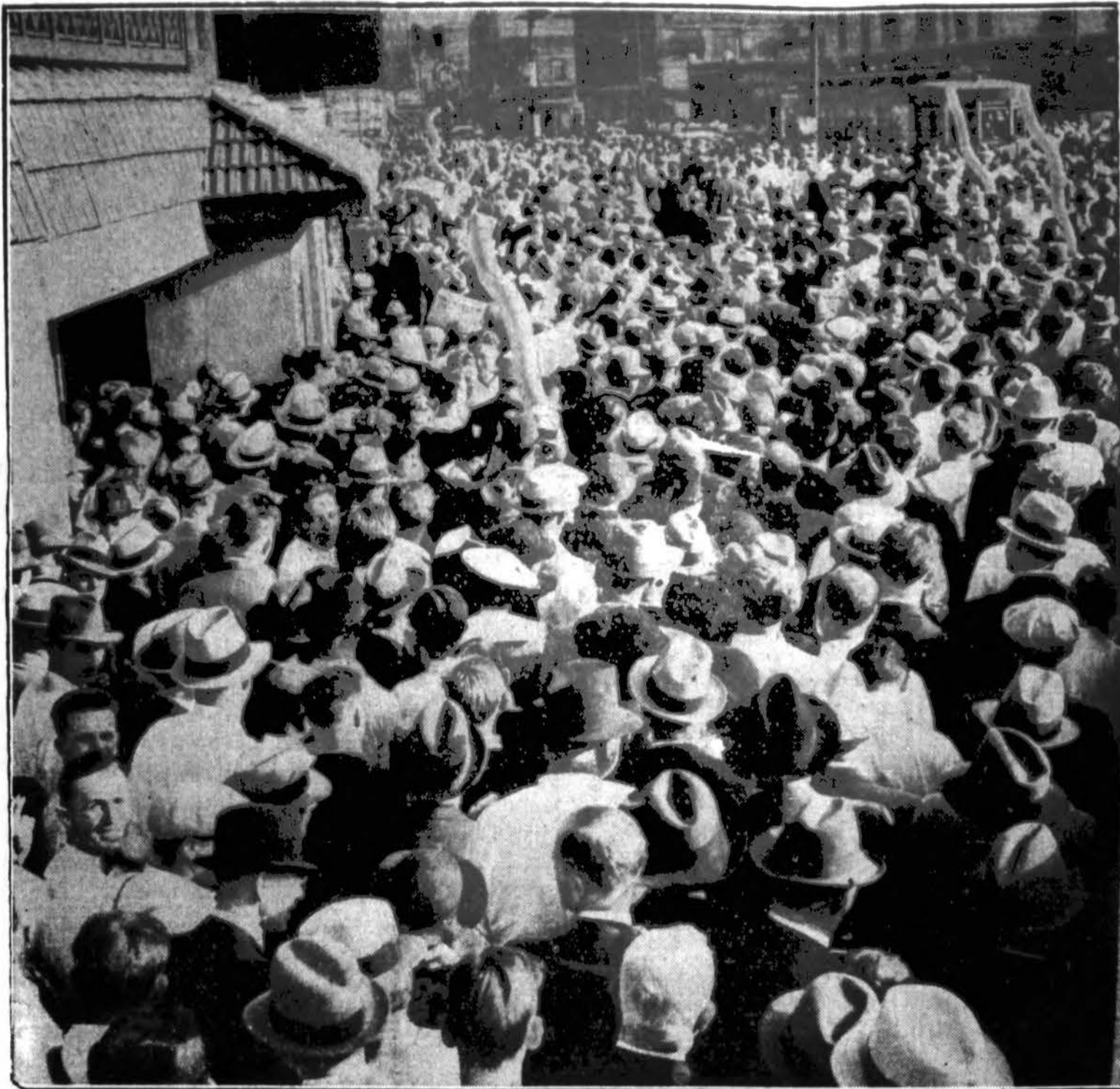
Kas jiems pasaulio problemos. Kada viso pasaulio valstybių diplomatų nervai įtempti dėl jau pačių viršūnių pasiekusio pavojaus pasaulio taikai ir civilizacijai, tūkstančiai čikagiečių užimti beisbole ir įtemptais nervais seka, kurie du tymai iš National ir American Lygų stos į "pasaulinę seriją" į kovą už šių metų beisbolės čempionatą. Šis vaizdas prie Wrigley beisbolės aikštės, kur Čikagos "kabsai" ("Meškiukai") supliškė New Yorko "džaiant" ("milžinus").