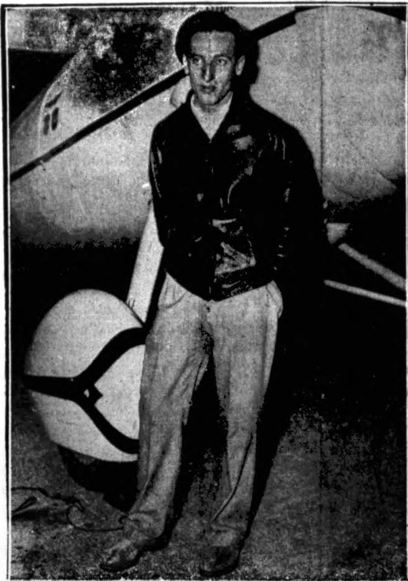
Lakūnas Feliksas Vaitkus, kurs iš Amerikos skrido į Lietuvą ir buvo priverstas nusileisti Airijoje. Lėktuvas Lituania II sudaužytas, bet Vaitkus išliko sveikas.