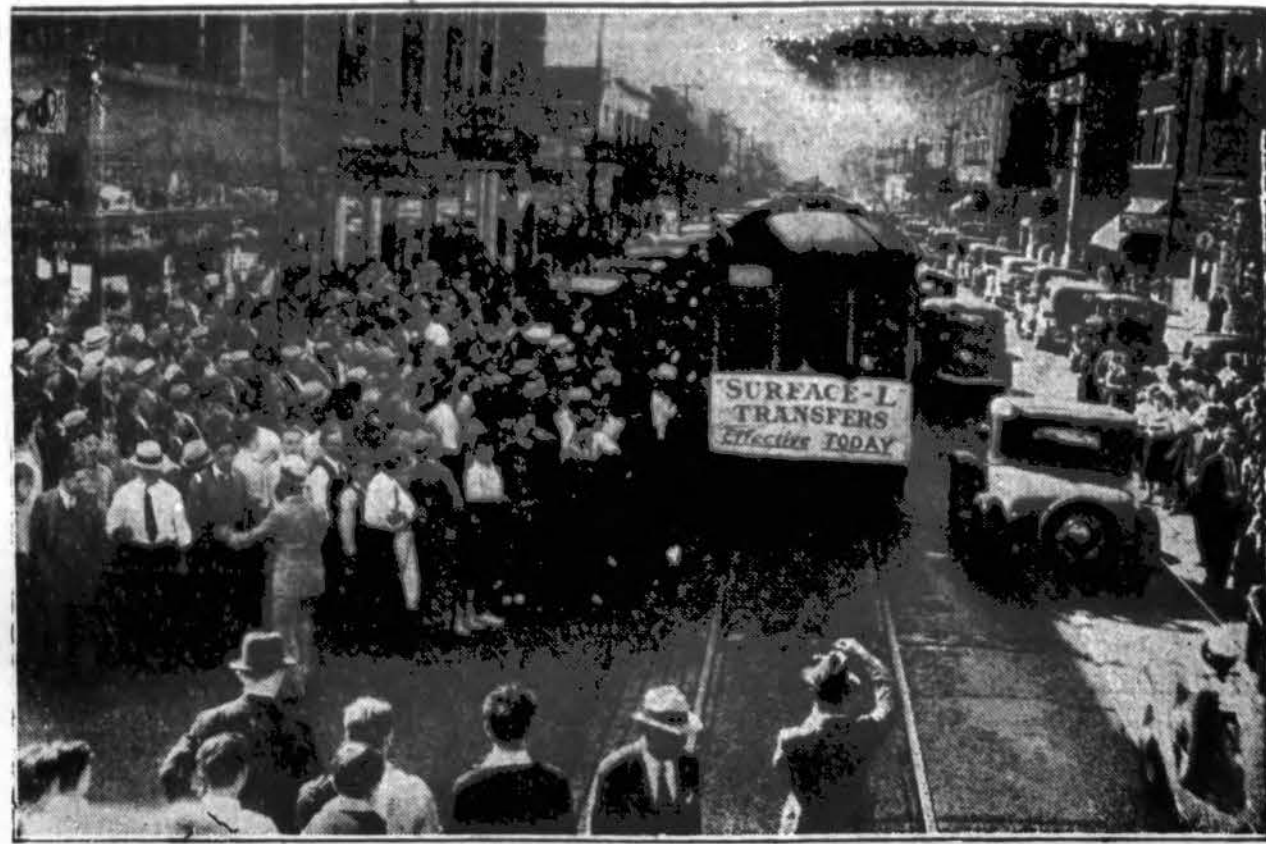
Bendrųjų transferų įvedimo iškilme. Su praėjusiu sekmadieniu Chicagoj įves-ta bendrųjų transferų tarp gatvėkarių ir viršutinių geležinkelio (eleveiterių) siste-ma. Šis vaizdas prie Lawrence ir Kimball avenues.

Dienraštis "Draugas", ku-ris daug prisidėjo sukelti skri-dimui kapitalą ir neatleistinai spyrė organizatorius, kad skri-dimą įvykintų, dabar, tam skridimui jau vykstant, džiau-giasi, kad lietuvių visuomenės pastangos galų gale siekia ti-kslo. Ir nors antrojo skridi-mo nedovanotinas vilkinimas daug pagadino amerikiečių lietuvių vardą Amerikoje ir Europoje, tačiau gautoji lek-cija (Ji buvo brangi!) tebū-nie pamoka ateičiai, kad "Su-valniui neik riešutauti..." X