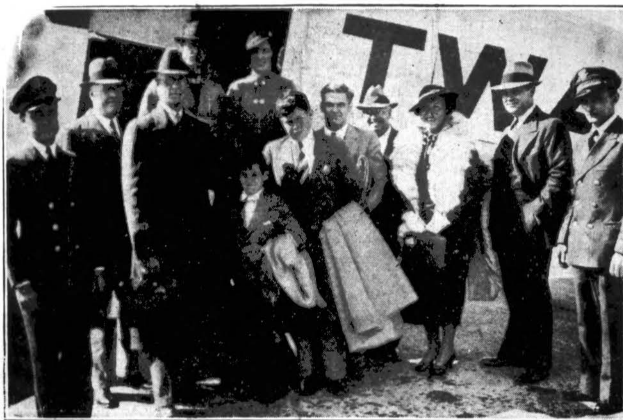
Pasažieriai orlaivių stotyje atkeliavo orlaiviu iš New Yorko į Chicago per 3 val. 20 minutų.