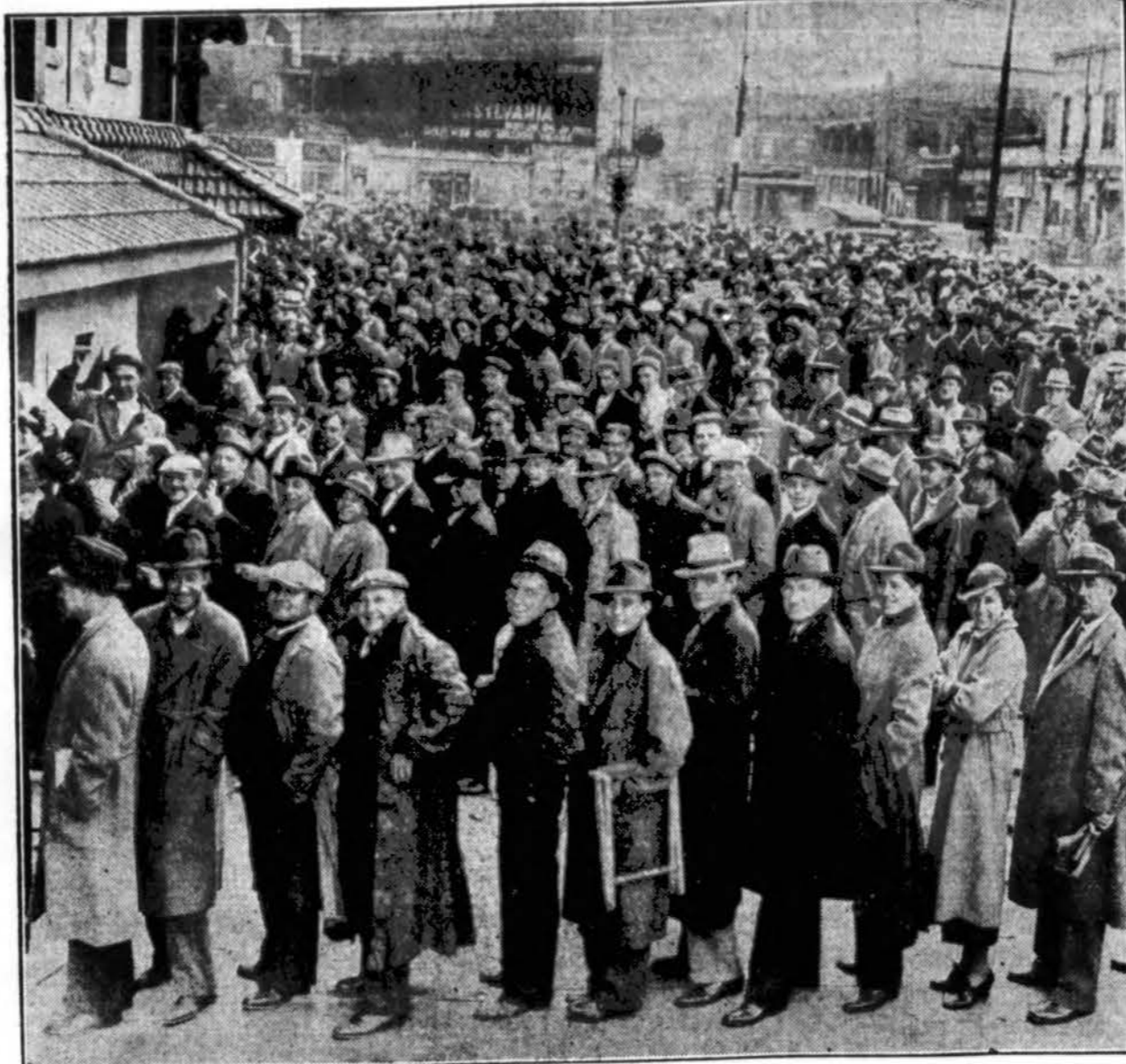
Žmonių minios prie beisbolo lauko laukia eilės nusipirkti tikiety.

Spalio 1 d. Šv. Jurgio bažnyčioj buvo iškilmingos laidotuvės a. a. Stanislovo Lesčinsko, kuris tapo nužudytas gal-