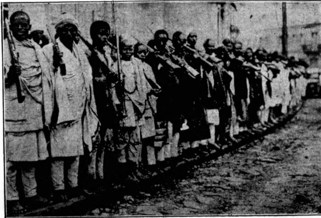
Vaizduojama vienos etiopiečių giminės nuožmieji kariautojai, pasirenę guldinti galvas už savo krašto nepriklausomybę kovojant prieš italus. Tai nėra reguliariai kareiviai.

ETIJOPIEČIAI PASIRENĖ GINTI KRAŠTO NEPRIKLAUSOMYBĘ