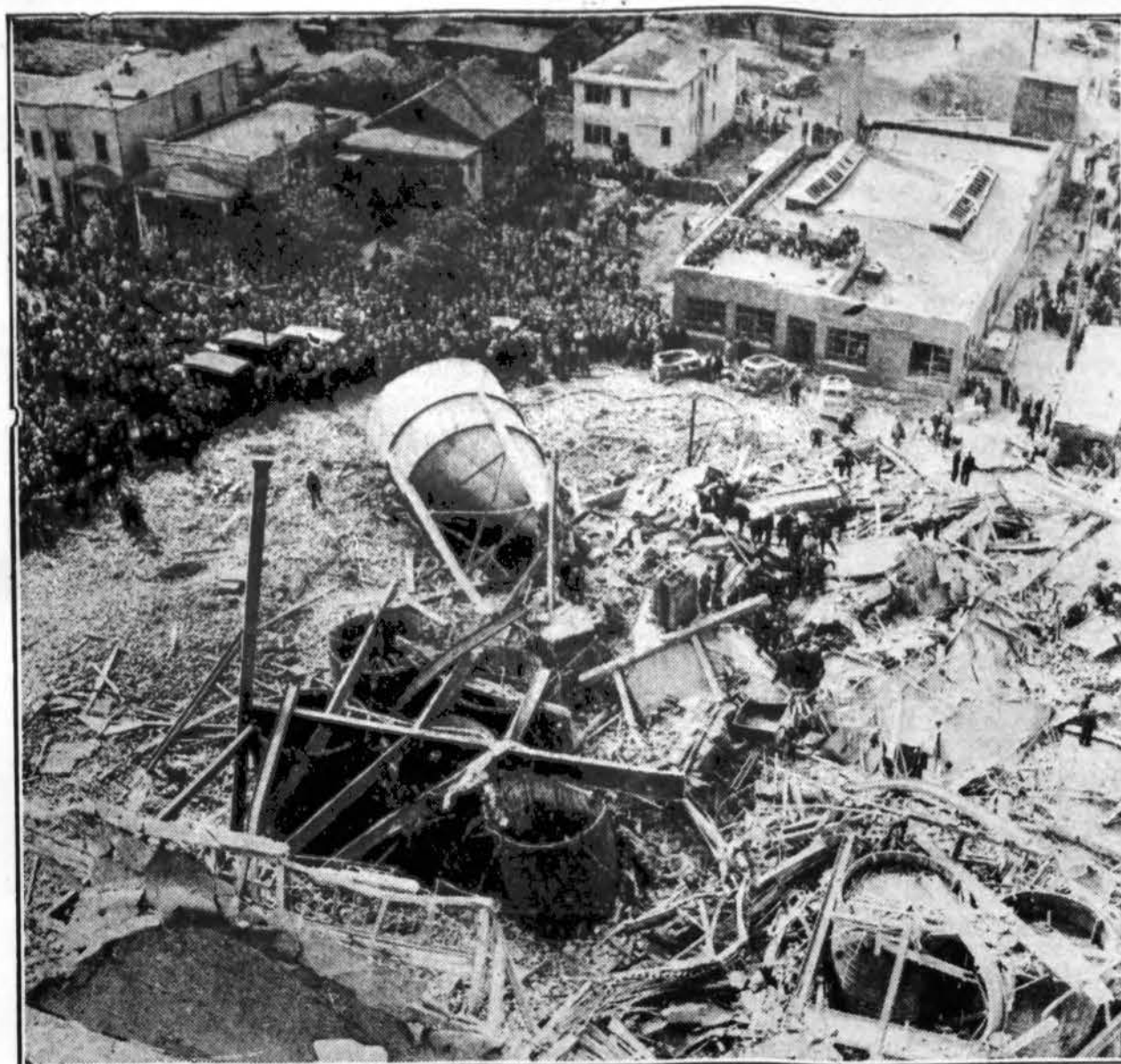
Fabrikio griuvėsiai. Glidden Soya Products Co., 1845 N. Laramie ave., fabrikas po milžiniško sprogimo, kuriame žuvo ne toli 40 darbininkų.