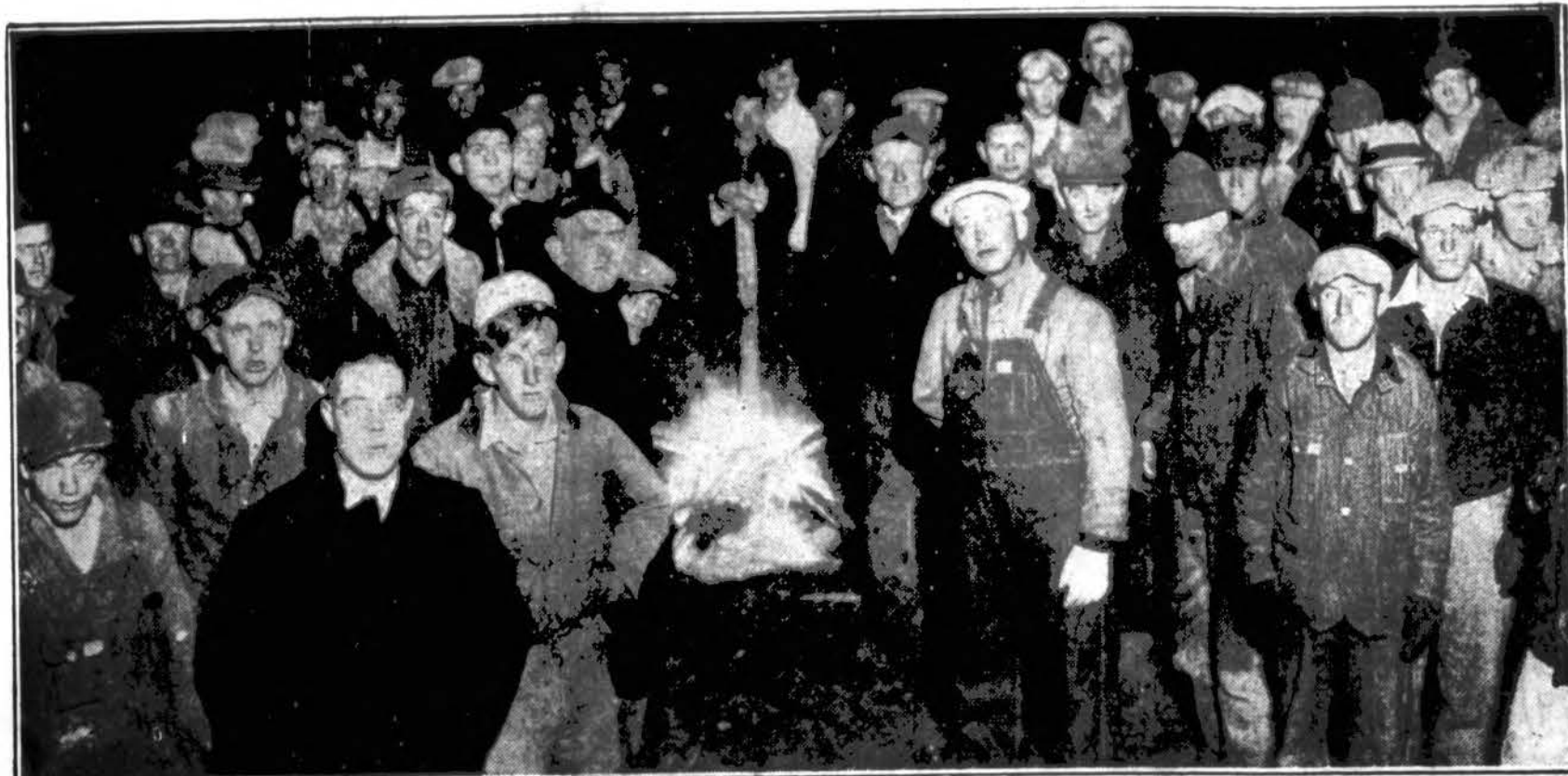
Tai streikuojantieji pieno pristatytojai ūkininkai žiemėje Illinois valstybės dalyje. Jie reikalauja, kad jiems daugiau būtų mokama už pieną. Streikas vis labiau įsigali ir kol kas autoritetai neturi pajėgų suvaldyti vežamo pieno naikinimą ir visoki streikininkų vedamą smurtą. Matyt, nebus apsieita be kariuomenės.

NETURI PASIRYŽIMO PASIDUOTI STREIKUOJANTIEJI ŪKININKAI