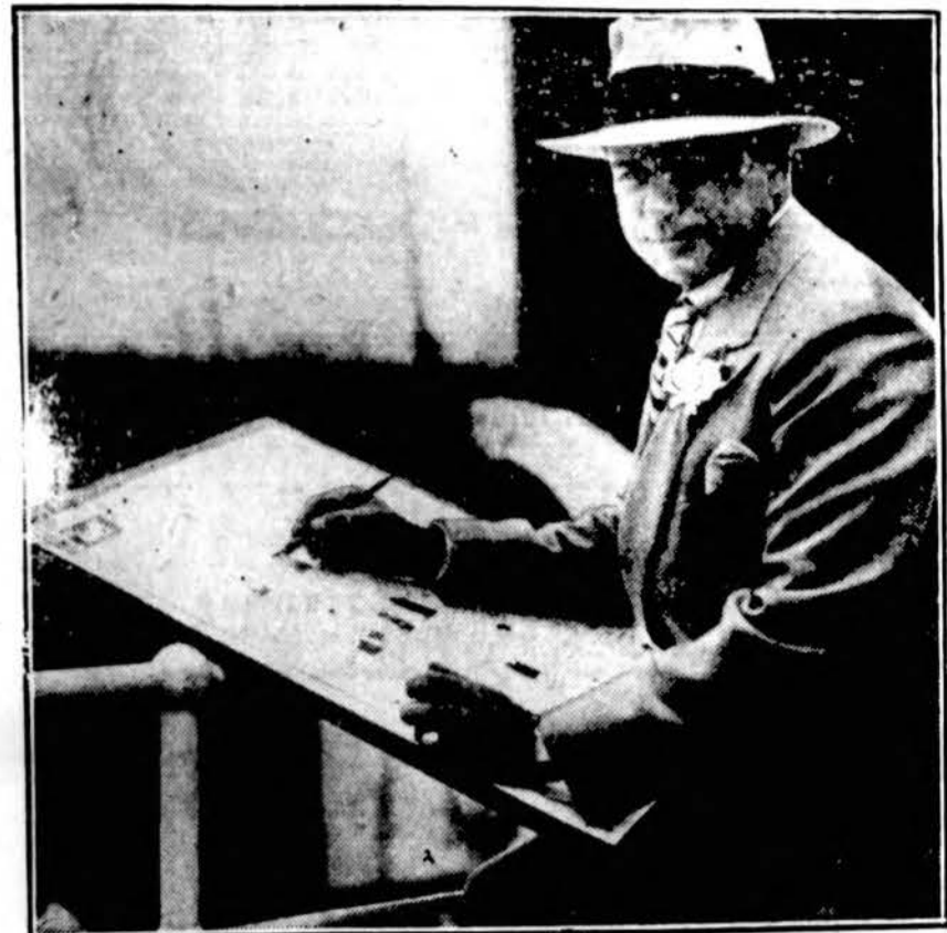
Žuvo "The Gumps" kurėjas. Žymus Chicago Tribune kartunistas Sidney Smith savo darbo kabinete. Praeitą sekmadienį jo automobilii susikūlus su kitu automobiliu ant N. S. highway 14, netoli Harward, Ill., tapo ant vietos užmuštas.

Ši paroda tai yra tikras Mažosios Lietuvos lietuviškumo įrodymas. Joje išstatyti dokumentai apie to krašto lietuviškumą yra paskelbti ne kiekio nors kitų, bet tų pačių vokiečių rimčiausių mokslininkų. Jie sakė, kad dar ir dabar Mažosios Lietuvos žemė kvėpuoja jos lietuviškos praeities dvasia. Šio krašto lietuviškumui įrodyti mokslininkų dar būtų per mažą. Patys krašto vietovardžiai ir lietuviškos dainos, Liudvikos Rėzos ir kitų tautosakininkų užrašytos, liudija, kad čia žmonės gyveno tuo pačiu gyvenimu, vargo tuos pačius var-