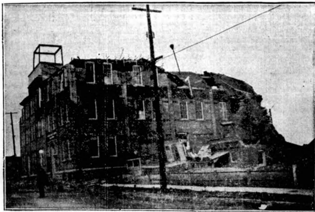
Iš žemės drebėjimo Montanoj. National Biscuit Co. sandėlis, Helena, Montana valst., po žemės drebėjimo, įvykusio praėjusį sekmadienį.