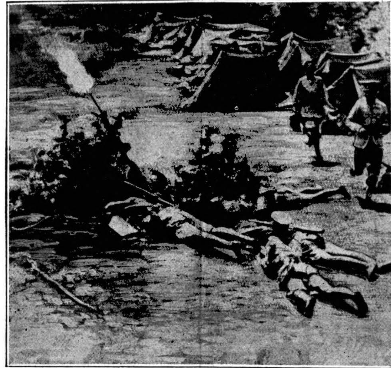
Etiopijos kareivių stovykla netoli Harrar, rytiniame karo fronte. Krašto ginėjai apsaudo italų lėktuvus, kurie svaido bombas. Aktualus vaizdas persiųstas su radijofono pagalba. Sakoma, užpulti iš oro etiopiečiai daug nukentėję.