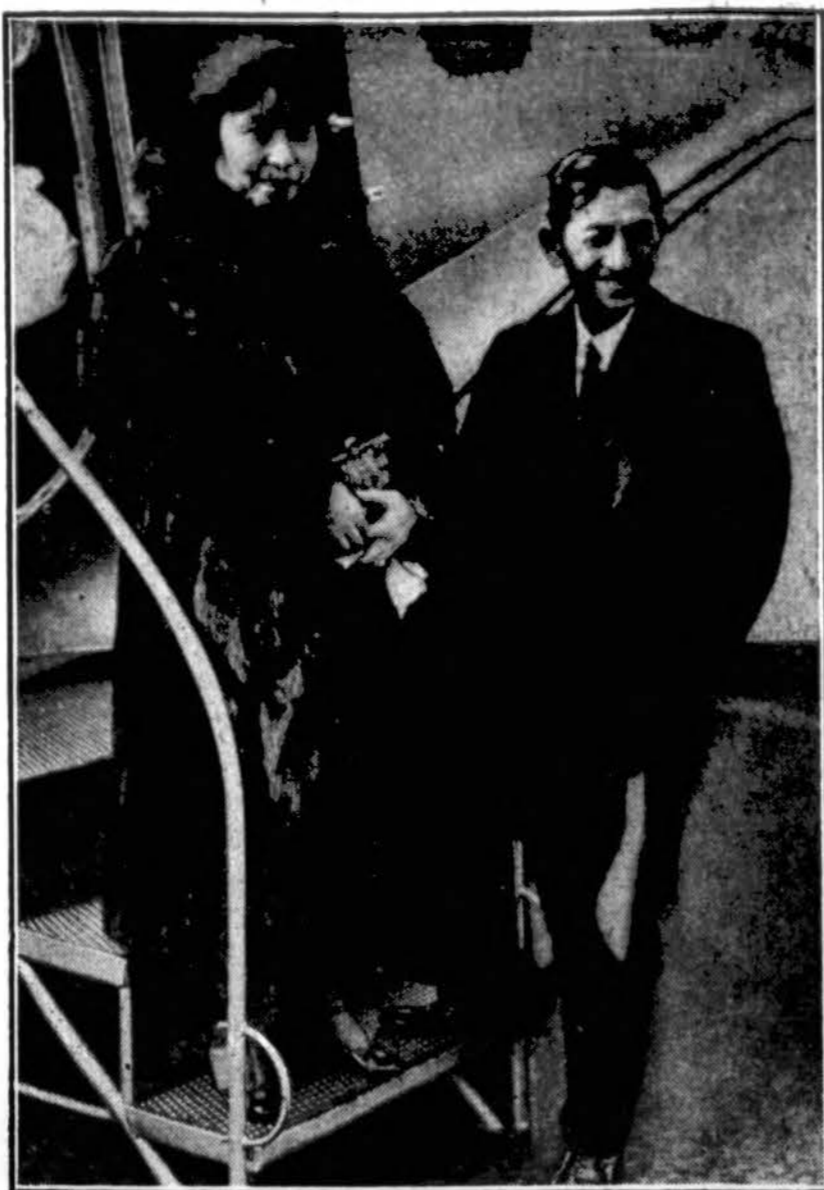
Japonų ambasadorius Am. J. Valstybės Hirosi Saito, kurs tomis dienomis lankėsi Chicagoj. Su juo yra jo žmona.