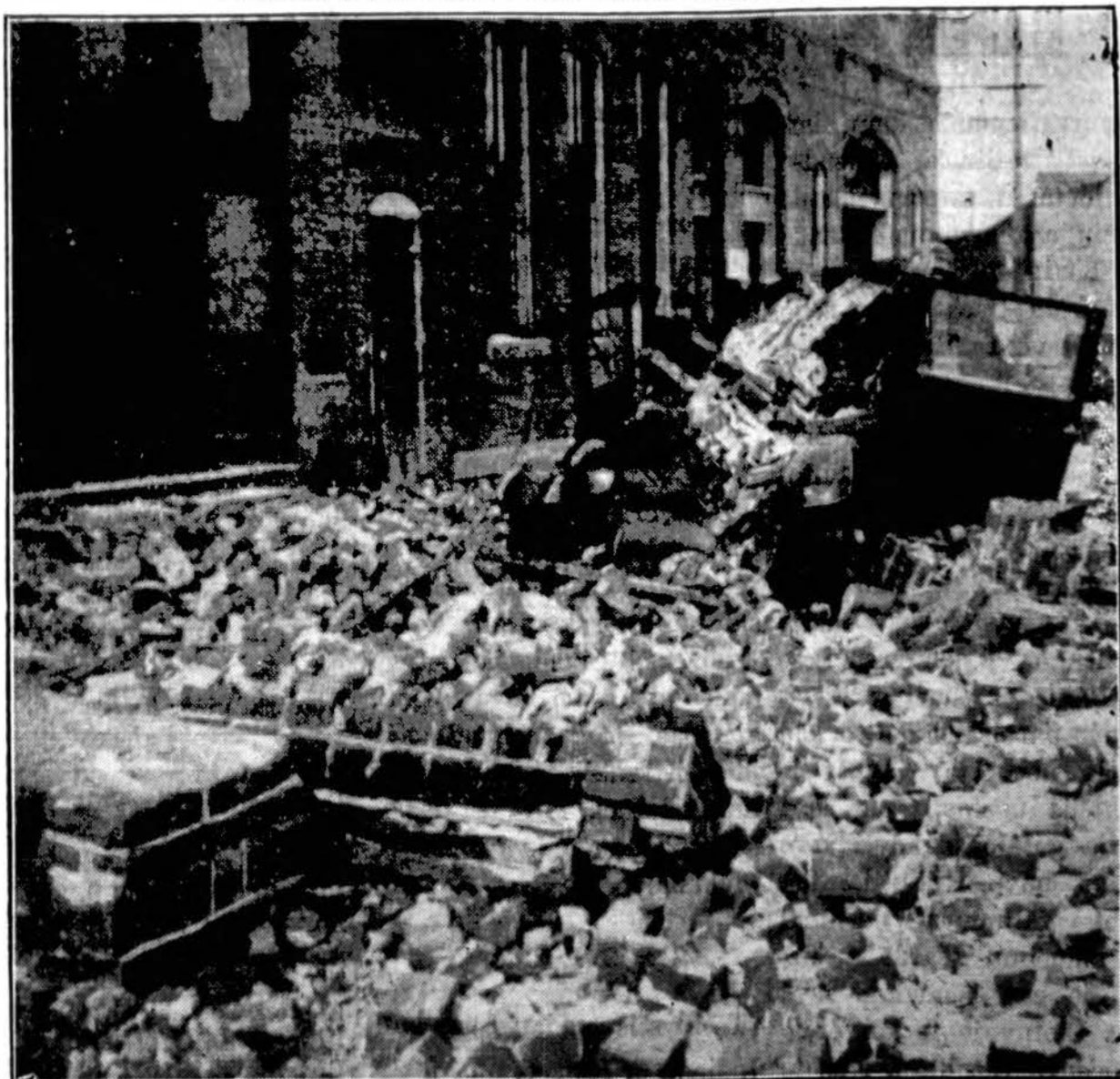
Apie šį drebėjimą keletą kartų buvo rašyta "Drauge." Čia vaizduojama, kaip atrodo viena gatvė — sugriautų namų plytomis ir griuvėsiais užversta.