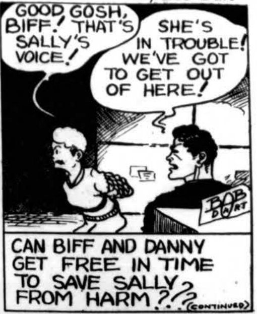
CAN BIFF AND DANNY GET FREE IN TIME TO SAVE SALLY FROM HARM? (CONTINUED)