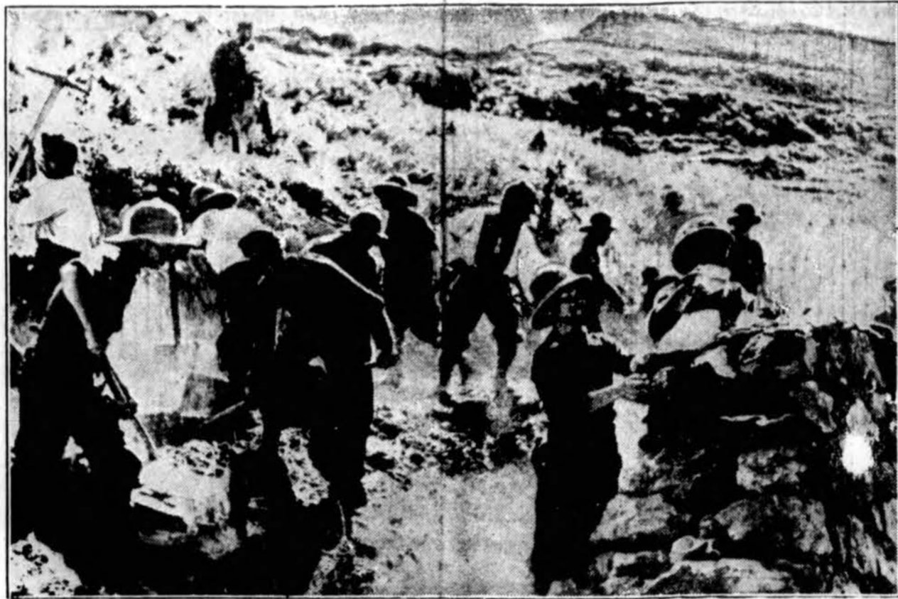
Italai priverčia etiopiečius dirbti sunkius darbus užimtuose Etiopijos plotuose. Korespondentai praneša, kad net 7 metų amžiaus vaikai skaldo akmenis, kurie reikalingi militariniams keliams. Sakoma, kad italai užmoka už tą privalomą darbą.