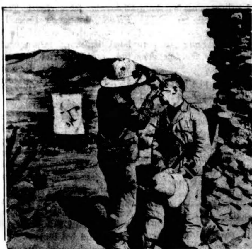
Karo fronte. Sunaikintos Adegos tvirtovės pavėsy italų kareiviai poilsio metu skuta vieni kitiems barzdas.

Dėkodami amerikiečiam už taip brangų geradarį, lietuvių saleziečiai pasiuntė į Ameriką saleziečių darbų filmas, judamuosius paveikslus, kurių pagalba geriau pažinseite didžiojo žmonių geradario šv. Jono Bosko ir jo