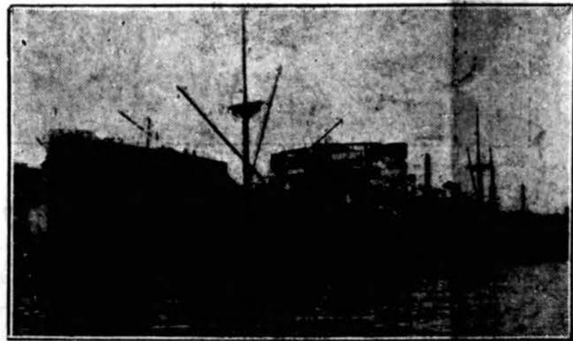
Šis britų laivas Silverhazel užplaukė ant uolos ir perlūžo pusiau. Apie 100 keleivių ir įgula išgelbėta ir laikina paimta San Bernardino salon.