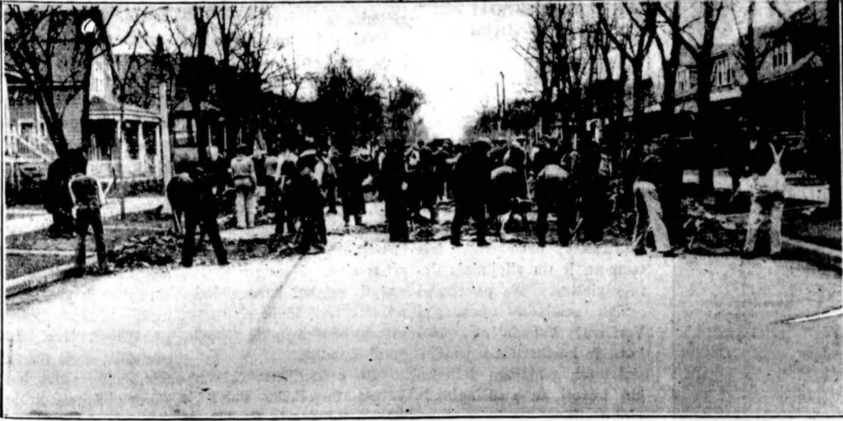
Ardo gatvę, kad padaryti darbo bedarbiams. Taip darosi ant Avenue G prie 107 g-vės. Apylinkės žmonės susirinko ir stebėjosi, kas čia darosi, nes gatvė buvo tvarkinga. Tiek ir tiek yra Chicagoj taisyntų gatvių, bet pasirenkama tokios, kurios dar tvarkoj. Tai rodo netvarką WPA administracijoje.