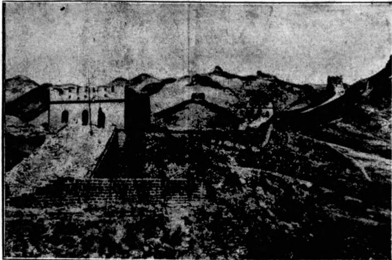
Didžioji istorinė Kinijos siena ties Sanhaikwan, kur ji atsiremia į jūrą. Ši siena atskiria žemę Kinijos dalį nuo Mandžukuo. Japonų kariuomenė jau perėjęs šią sieną, kad žemės Kinijos provincijas atskėlus nuo Kinijos valstybės ir įkurus naują "autonominę" valstybę.