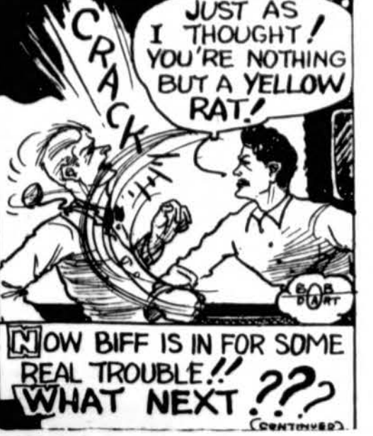
By Bob Dart NOW BIFF IS IN FOR SOME REAL TROUBLE!! WHAT NEXT???

sė prie parapijos choro ir buvo L. V. "Dainos" choristė.