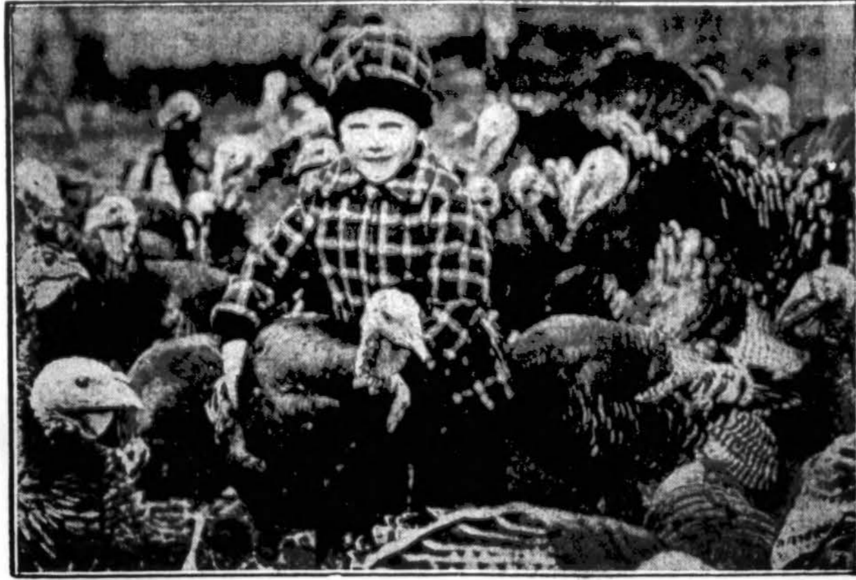
Padėkos diena atėjo. Sunset kalakutų farmoje, prie Rand Rd. ir Dundee Rd., netoli Chicagos, vaiktis sugavo kalakutą Padėkonės dienaž.

Bet kodėl gi taip dažnai angelai žvilgčioja į niūrią, juodą žemę, į mažas jos būtybes — žmones? Kodėl nuliūsta jų linksmas žvilgsnis, išvydęs tas mažas būtybes? Mat, juk ir jie buvo tokios pat būtybės, juk jie ištvėrė savo bandymo