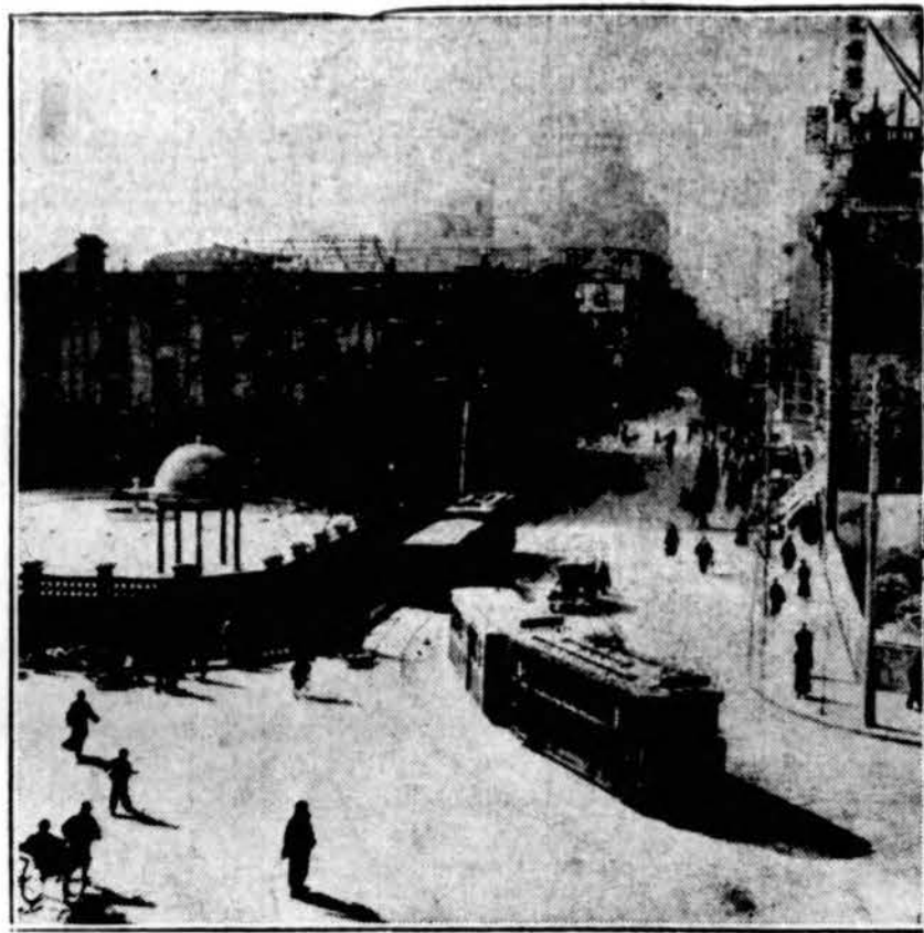
Kinijos miestas Tientsin, kur buvo kilęs maištas.