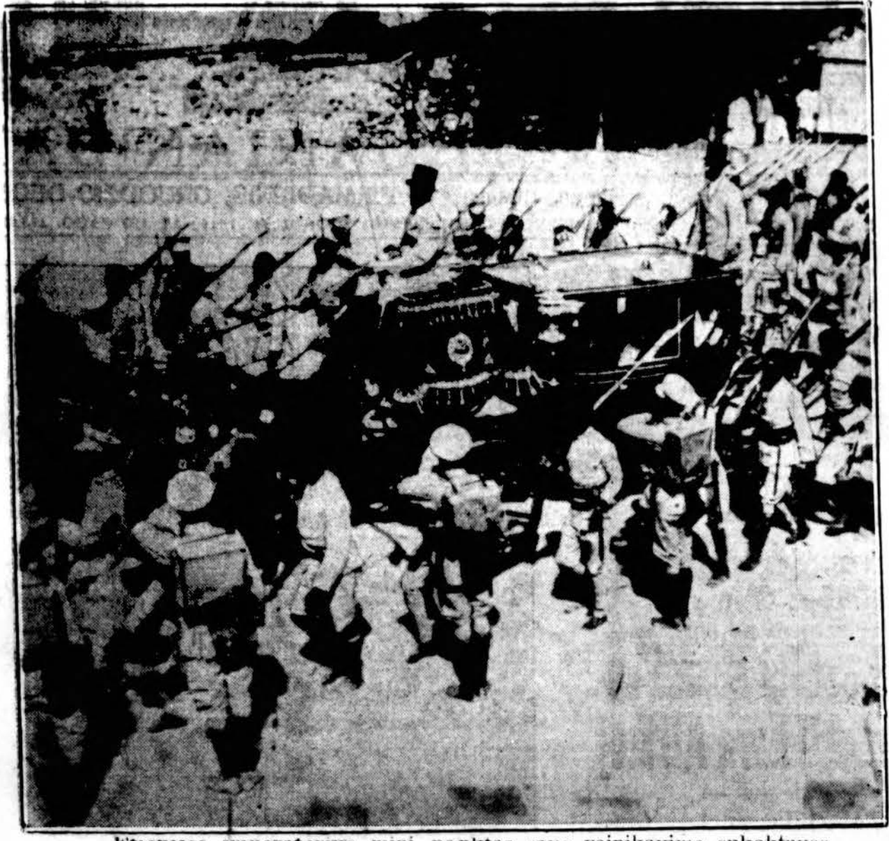
Etiopijos imperatorius mimi penktas savo vainikavimo sukaktuves. Jisai važnuoja sostinės gatvėmis karietoj, kurią seniau turėjo kaizeris Vilius.

Pasekmingiausias būdas kovoti su komunizmu yra - įvesti naują socialinę tvarką. Katalikai turi plėsti savo akciją, kad katalikiškas socialinis mokslas būtų įgyvendintas ekonominiame gyvenime ir valdžioje. Tai arčiausias kelias į krašto ir visų žmonių gerovę. Kuomet žmonės dirbs, gaus teisingą atlyginimą ir gerai gyvens, komunizmui vietos jų tarpe nebus.