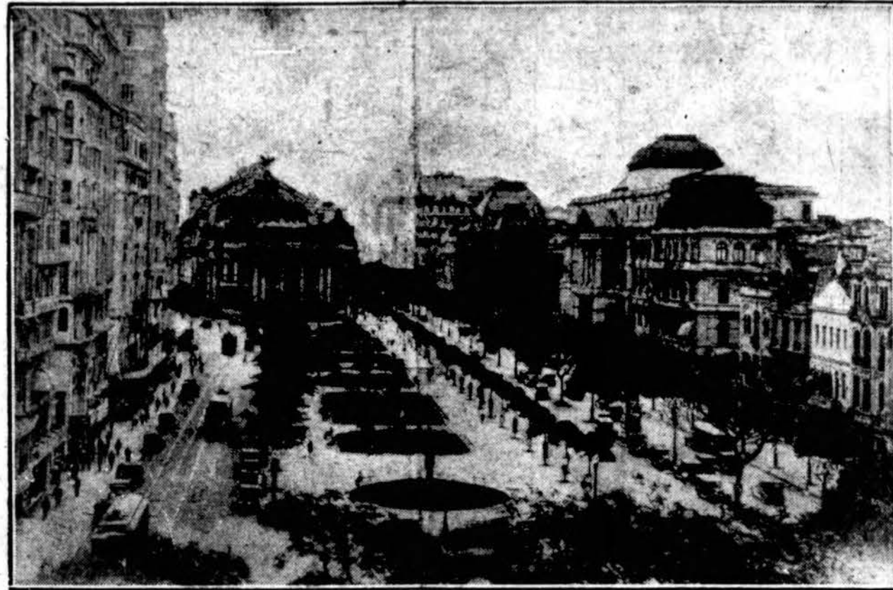
Brazilijos sostinės Rio de Janeiro vaizdas. Kaikuriuose Brazilijos miestuose, taipgi ir sostinėj buvo kilę maištų. Įvykusiuose susirėmimuose žuvo 38 kareiviai. Iš viso žuvo 150 žmonių.

Tai, esą, dėl to, kad padidintas atlyginimas pieno iš-vežiotojams ir ūkininkams kainos už pieną.