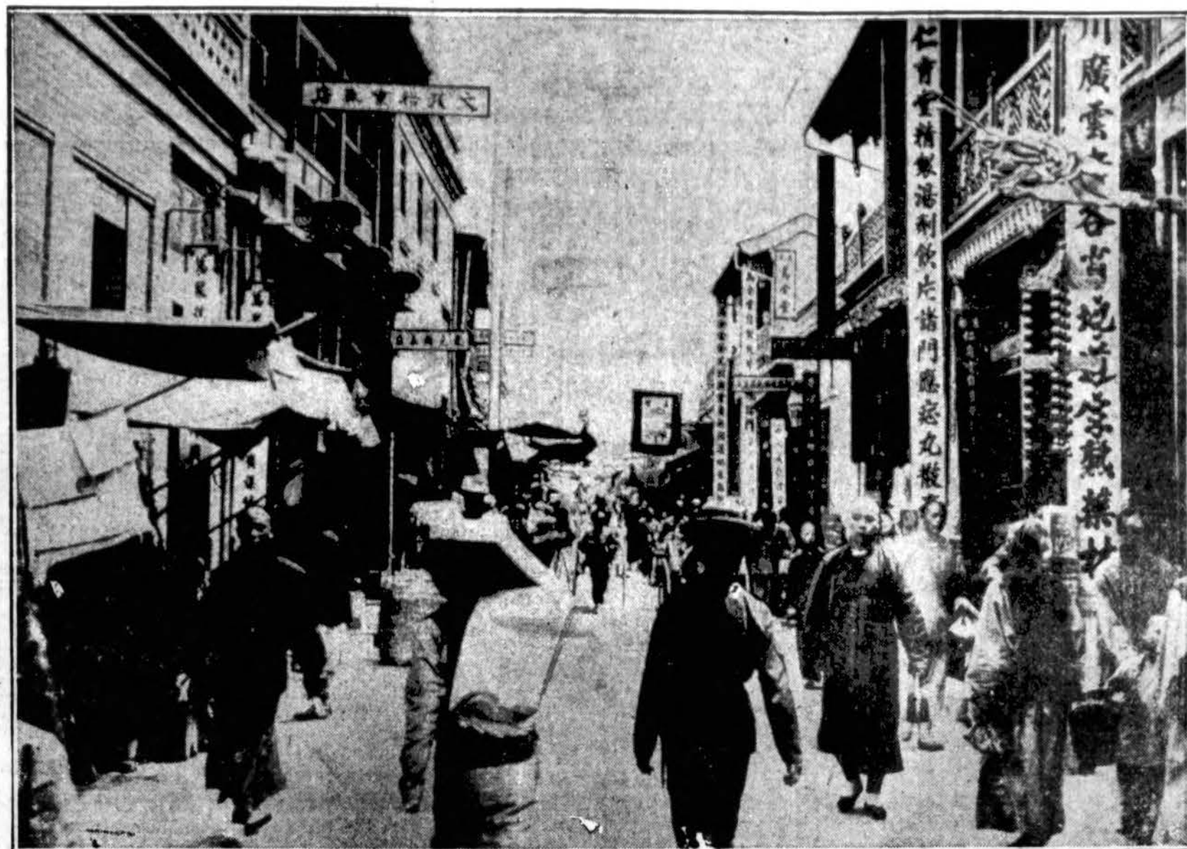
Kinijos miestas Tientsin, į kurį Japonija siunčia kariuomenę. Europos valstybės susirūpino Japonijos žygiais prieš Kiniją, ypač Anglija yra susirūpinusi.

gio parapijos choras, ir orkestra, vadovaujant komp. A. S. Pociui.