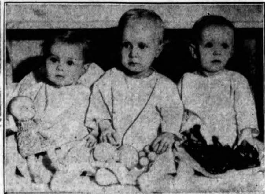
Iowos fermerka ėjo pernai lenktynių su Kanados fermerka, kuri pagimdė penkiukus. Iowos fermerka pagimdė keturiukus, bet po dviejų mėnesių vienas mirė. Čia matome tris gyvuojančius.

Dr. Dafoe kasdien mergaites atlanko, kad patikrinus skonių kaip atliko Šv. Jurgio parapijos choras.