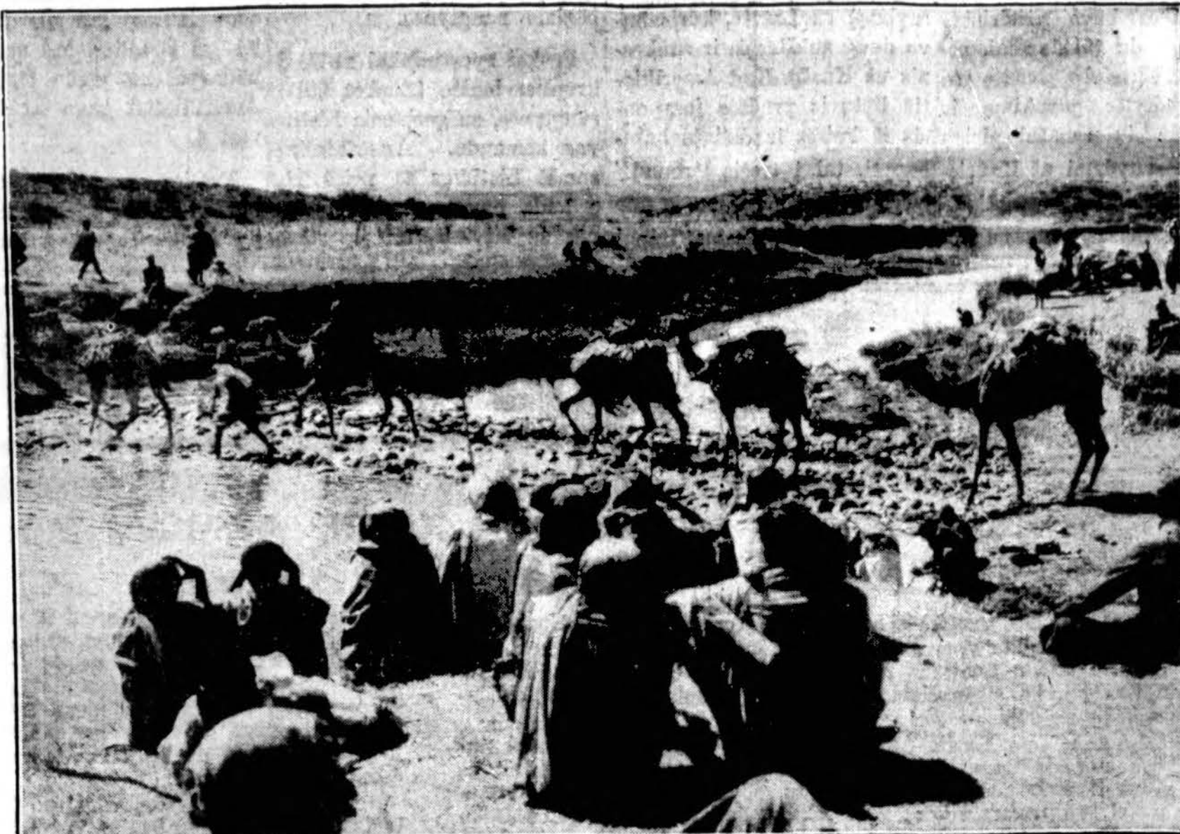
Etiopiečiai žiūri į italų kareivius jojančius ant kuprių. Kupriai brenda per negilų upelį.

Sportininkai išvažiavo iš Lietuvos su nepaprastais išpuoliais.