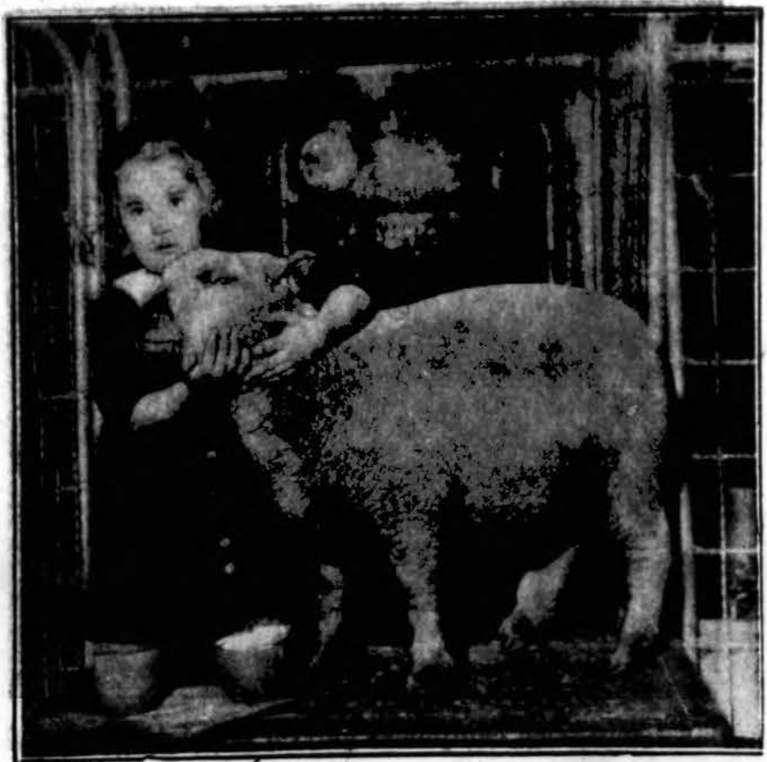
Galvijų parodoj Chicagoj. Avinas laimėjęs aukščiausią dovaną. Jisai yra iš Ontario, Canada.

Jau vien iš to ką parašiau, skaitytojai, nors iš dalies supras, kad panašiose aplinky-