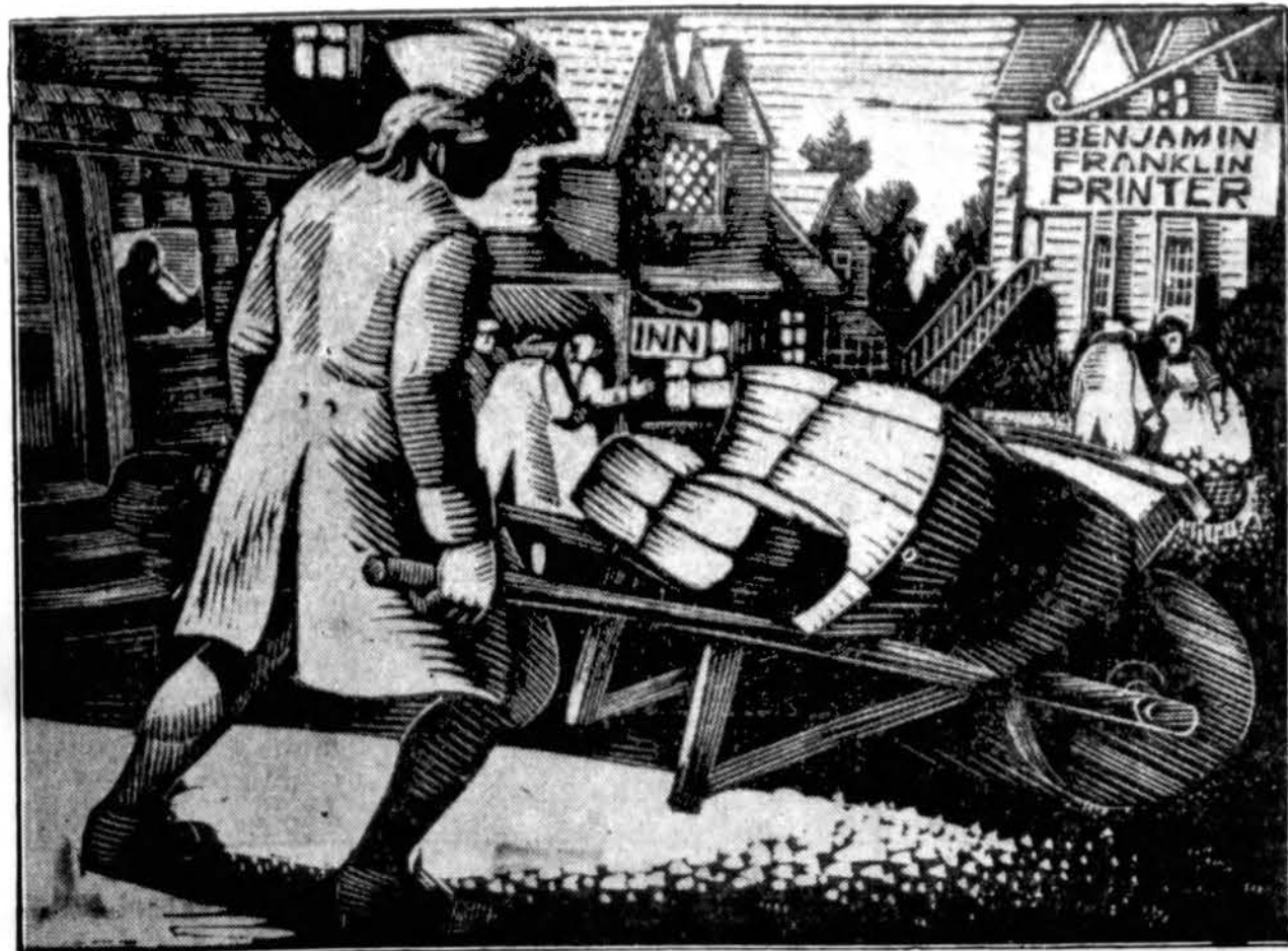
Paveikslas iš senos knygos. Vaizduoja garsųjį Benjamin Frankliną gabenantį knygas ant "wheelbarrow."