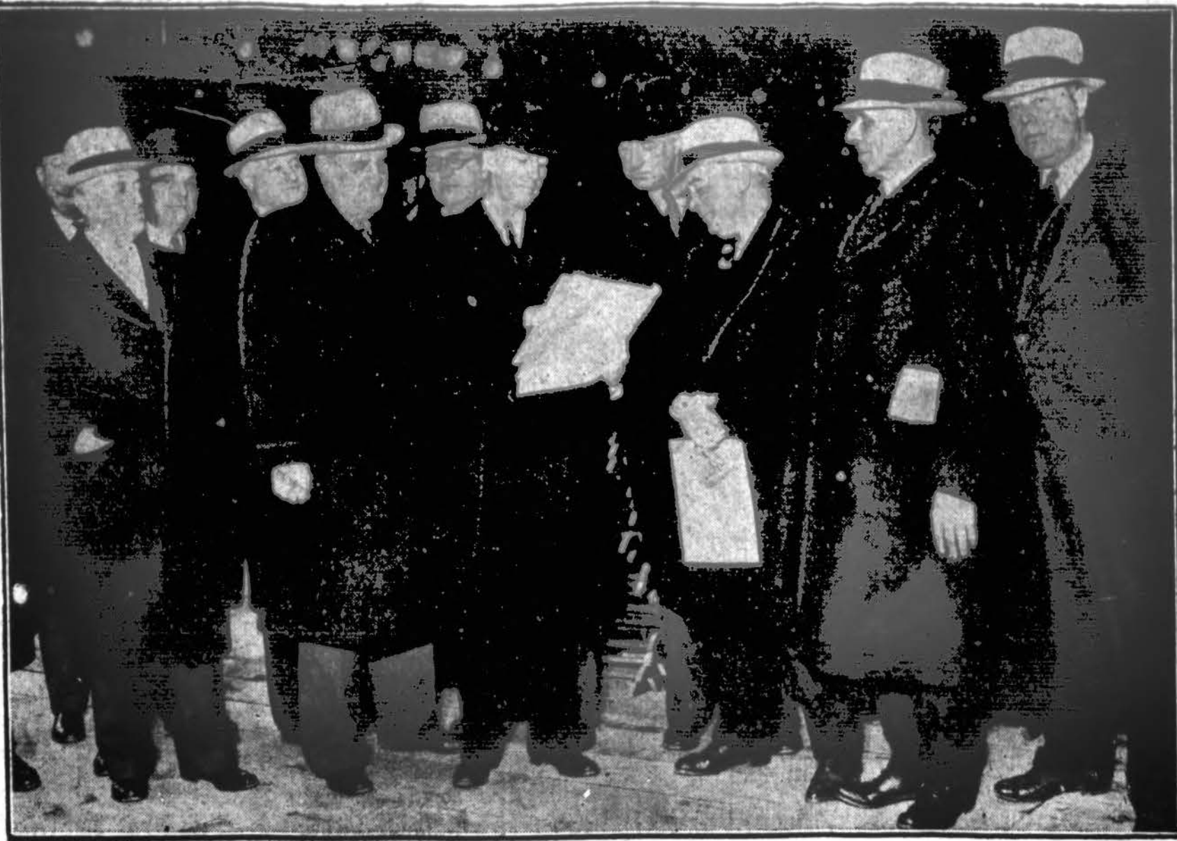
Federalės valdžios slaptieji detektyvai, kurie rūpinosi prez. Rooseveltto saugumu Chicagoj, jam atsilankius į "stock show".

nuo visos sumos tam tikrą procentą valstybės išdo naudai. Pagaliau, džiaugiasi darbininkai suradę teisybę, nežiūrint to, kad minėtoji firma buvo parodžiusi nesąžiningumo.