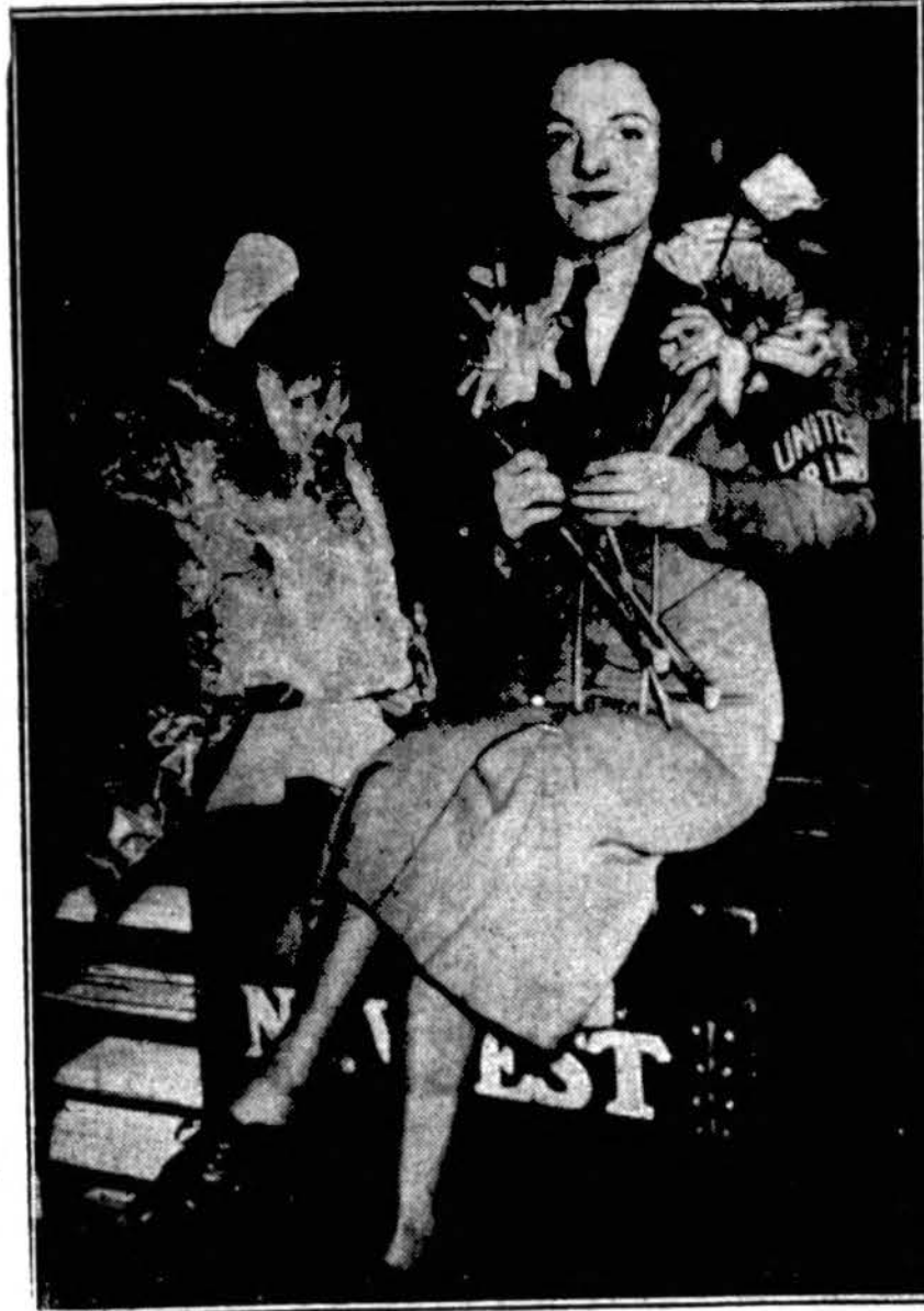
Gėlės iš Hawajų salų atgabentos į Chicago per 48 valandas. Jos buvo atgabentos orlaiviu China Clipper.