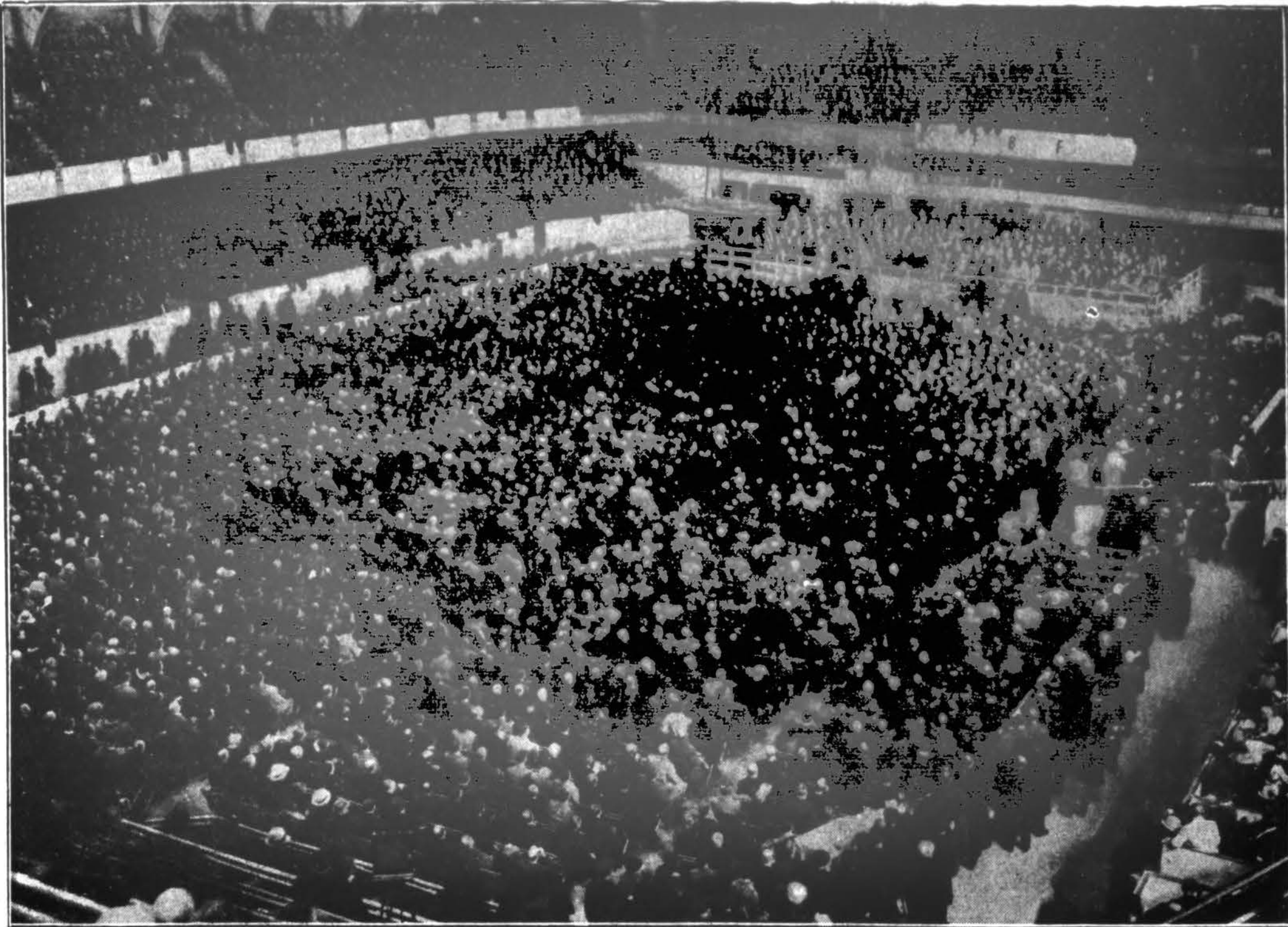
Minios Chicagoos stockjarduose, kuomet kalbėjo prezidentas Roosevelt. Didelė minios dalis yra fermeriai. Iš viso žmonių buvo apie 15,000.