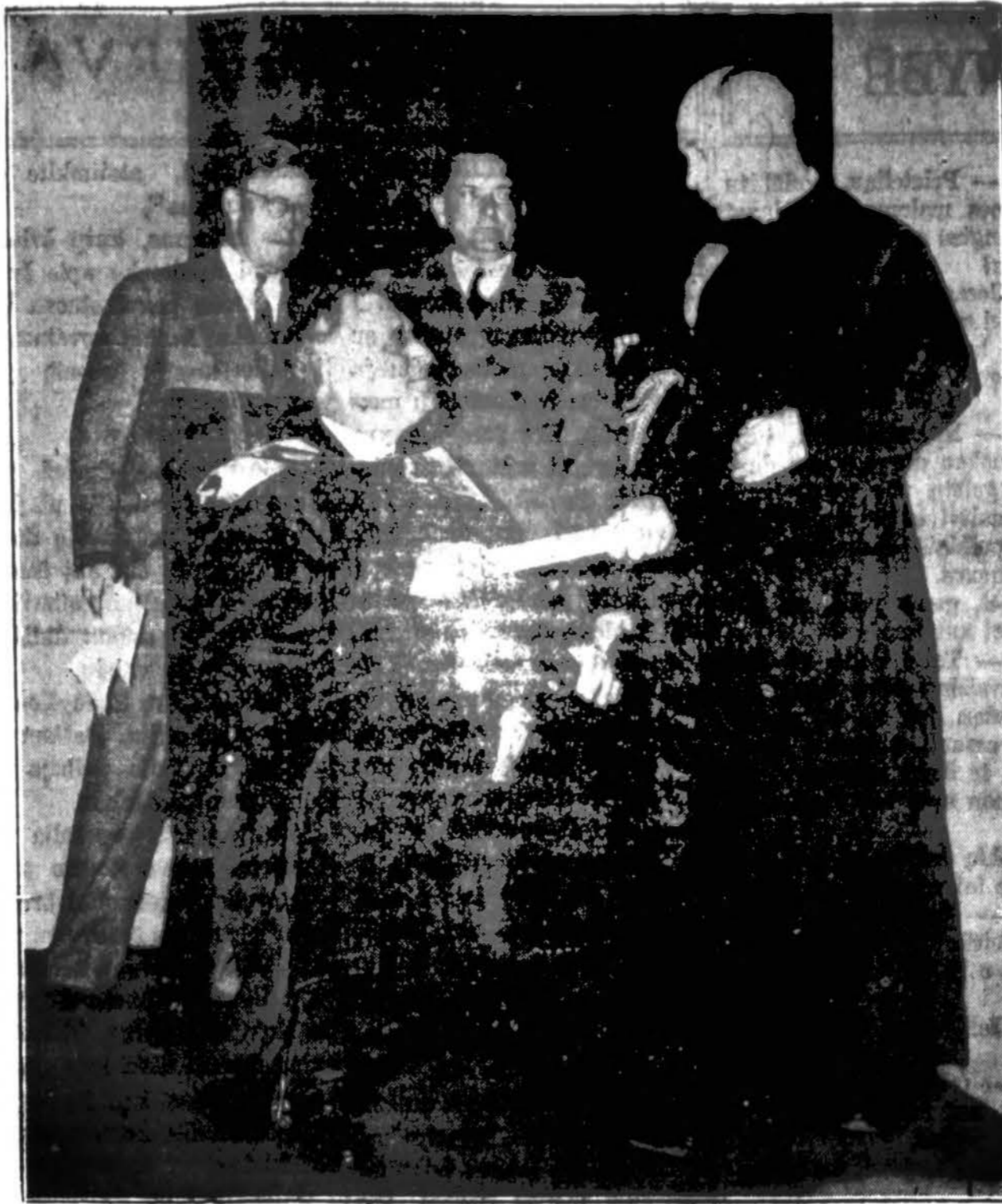
Prez. Roosevelt priima diplomą, teikiamą Notre Dame universitete. Tasai katalikiškas universitetas suteikė prezidentui teisių doktoratą už jo nuopelnus Amerikos respublikai.

Laikraščio redaktoriū turi išspausdinti įstaigos, draugijos, bendrovės, sąjungos arba asmens raštą kurio je nevertodami atsakių ir įžūlių, priešingų geriems papročiams arba nusikalstamųjų posakių, nuneigia, atitaiso arba paaiškina žinias bet kuriuo būdu pagarsintas apie juos tame laikraštyje. Gautas raštas spausdinamas arčiausiajame numeryje, tame pat skyriuje ir to-